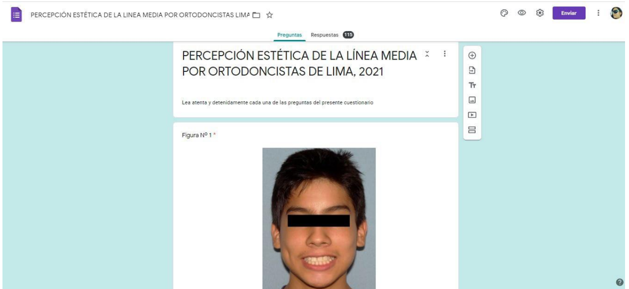
Figura 1. Cuestionario virtual realizado para los encuestados.