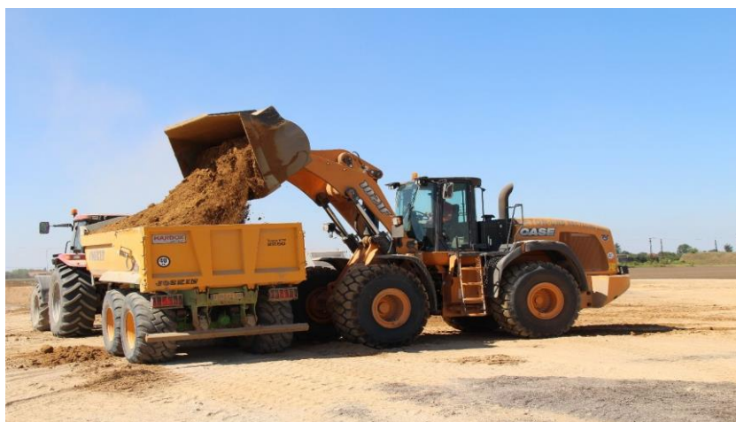
Figura 6: Tierra depositada en Tolvas