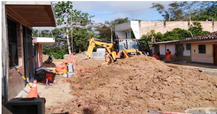
Figura 5: Material extraído

su excavación. Los materiales extraídos producto de la excavación se sitúan en un medio de transporte mediante la maniobra de carga, después de llegar a su destino, el material es situado mediante la manipulación de descarga. Esta puede realizar sobre el propio terreno, en tolvas que están diseñadas para este propósito, etc. Para su ejecución en trabajos públicos, es acostumbrado crear, con el material extraído, capas de espesor, aproximadamente uniforme, mediante la operación de extendido CHERNÉ y GONZÄLES (2016, pág. 7) Ver figura 5 y 6.