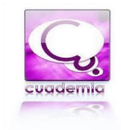
Figura 2. Presentación del cuaderno interactivo Cuaderna.