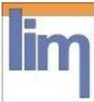
Figura 1. Presentación del portal de Edilim.

el título y subtítulo, autor, etc. También se pueden añadir sonidos y texto que actúen como feedback cuando el alumno realice los ejercicios.