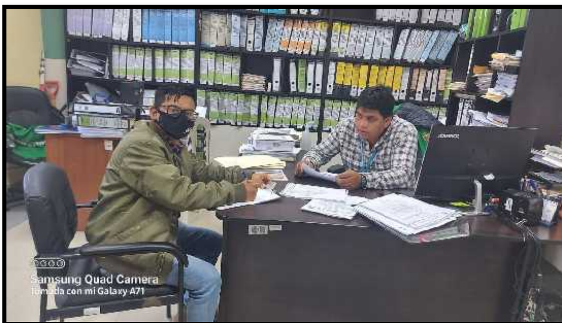
FOTO N°2: entrevista estructurada al gerente de obras de la municipalidad provincial de Otuzco