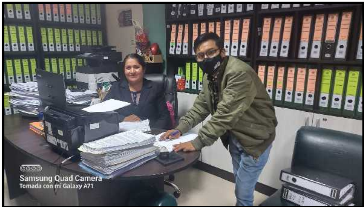
FOTO N°4: entrevista estructurada a la tesorera de la municipalidad provincial de Otuzco