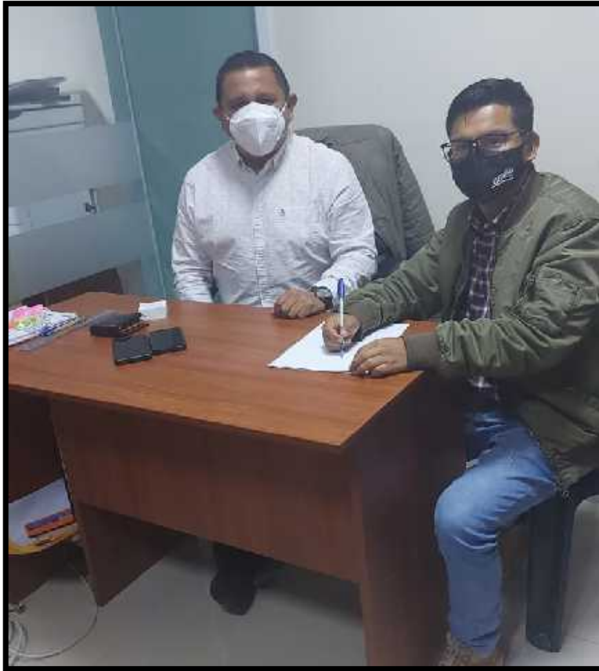
FOTO N°5: entrevista estructurada al área de alcaldía de la municipalidad provincial de Otuzco.