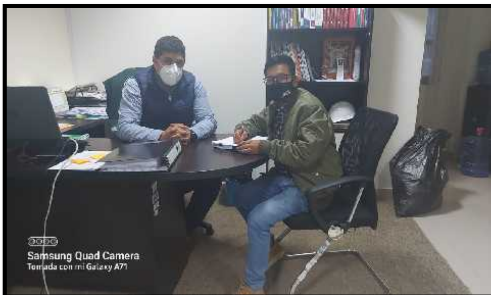
FOTO N°1: entrevista estructurada al gerente municipal de la municipalidad provincial de Otuzco.