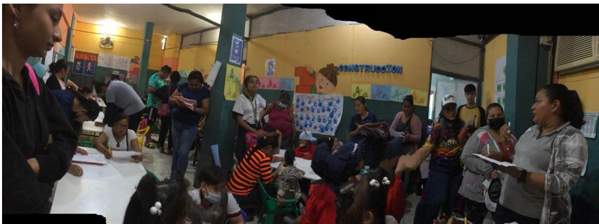
Fotografía tomada en la oficina de la Unidad Educativa “Dora Ramírez Márquez” en la recolección de datos (padres con sus hijos realizando el cuestionario)