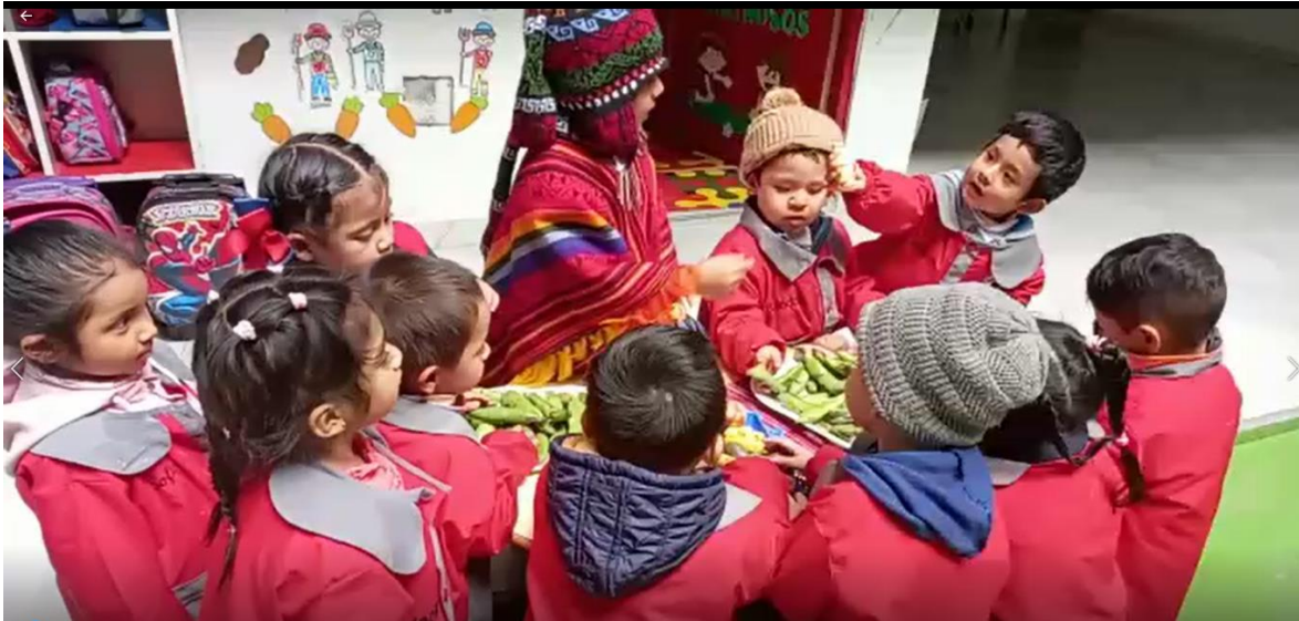
Gastronomía: preparación de la wawatanta abanquina