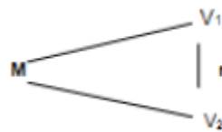
Figura 1 Esquema de Tipo de diseño

El nivel de la investigación es correlacional, de acuerdo a Gallardo (2017), el objetivo que se tiene es medir la relación que existe entre las notificaciones y la culminación de procesos judiciales, para lo cual se tiene que cuantificar y analizar la relación entre ellas.