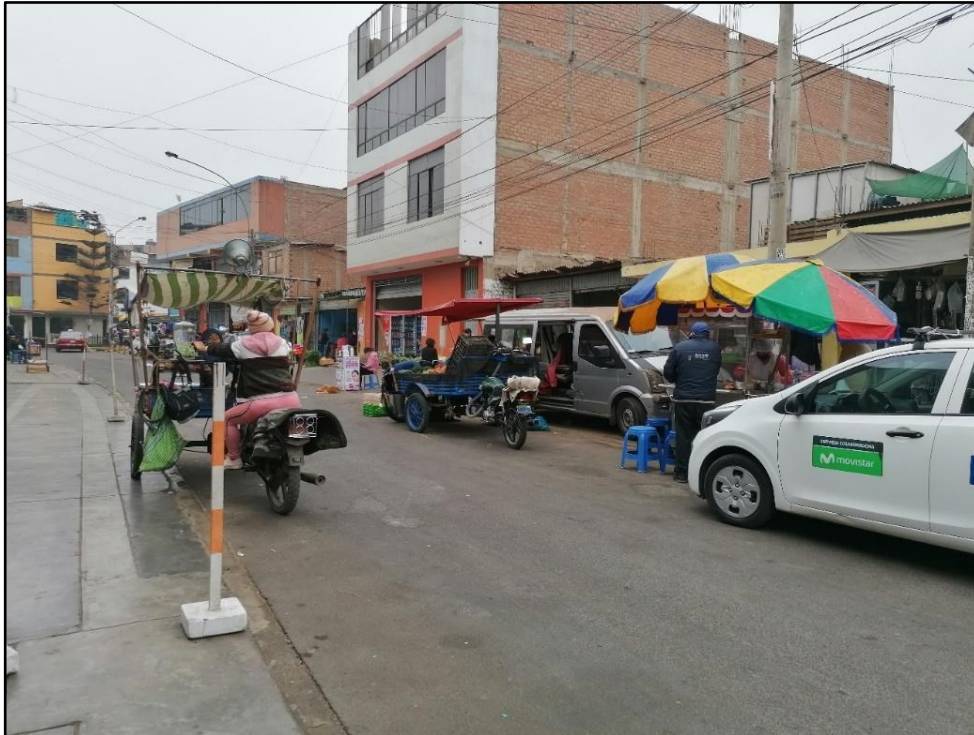
Martes 24 de mayo del 2022, 11:17 am.

Así mismo, se desarrolla el último escenario urbano por las noches, entre las 7:00 pm y las 12:00 am, en este horario, también es evidente, incluso más atrevido, la apropiación del espacio por parte de los comerciantes, y, generando más actos negativos de su parte, de hecho, aquí la informalidad es dueña de la calle; en este escenario se observó, del mismo modo, la venta de productos de comida, que están denominados como comida rápida o “fast food”, como las pizzas, las hamburguesas los broaster, etc.; este horario está determinado por que la gente llega a su hogar, después de cumplir con sus jornadas laborales o estudiantiles, y, el comportamiento humano que más resalta es el cansancio y el agotamiento físico, por esta razón, el escenario urbano se vuelve un área de recepción para estas personas, debido que, llegan, se cruzan con la venta de estos productos, consumen algún tipo de alimento y, luego, se retiran de una manera más sosegada a sus casas; por consiguiente, esto genera que el comportamiento social determine que la característica física de este escenario urbano que se presente sea bastante relajado.