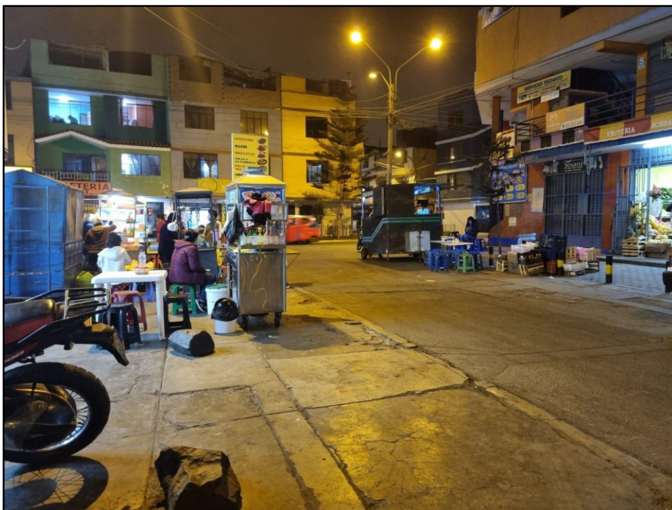
Jueves 26 de mayo del 2022, 8:42 pm.

Al mismo tiempo que se observó estos escenarios, y, en segundo lugar, esta información se contrastó con la opinión y experiencia propia de los entrevistados, se resultó y concluyó al problema general que, en efecto, la formación, evolución y características físicas de estos tres escenarios urbanos que se presentan a distintas horas del día, está determinado por el comportamiento de las personas en el lugar; además, se evidenció un dato muy relevante para nuestra investigación, que estas conductas y comportamiento de las personas están definidas por sus rutinas diarias o actividades cotidianas, son estas actividades que suelen realizar durante el día, así como, por la educación y formación que han tenido a lo largo de sus vidas; de este modo, contrastamos este resultado con la teoría de la autora Meneses (2009) dónde menciona que las conductas y comportamientos de los individuos, se dan, por una parte, por el significado que han adquirido durante toda su vida, esto quiere decir, en la formación de su experiencia individual y colectiva, y por otro lado, es el resultado de sus nociones e ideas que constituyen el mundo en el que viven a diario. En este caso, validamos lo mencionado por la autora, y, de la misma forma, recalamos la importancia de entender cómo se define el comportamiento humano,