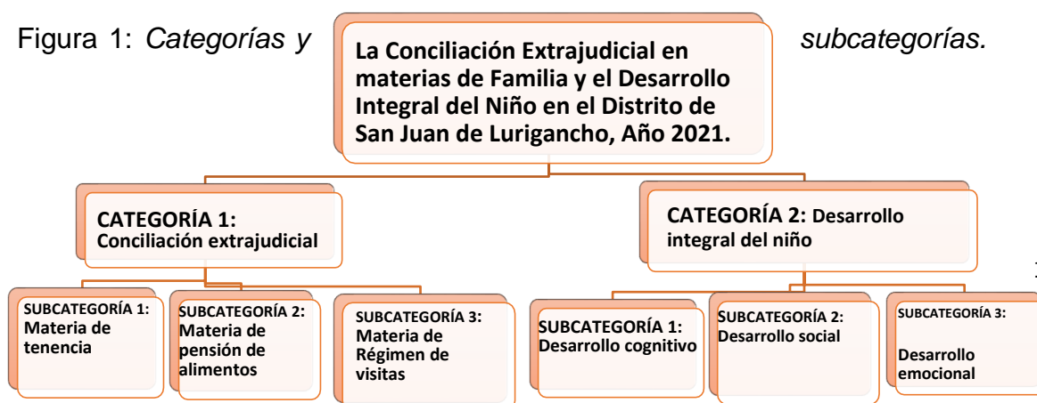
Figura 1: Categorías y subcategorías.

Como segunda categoría tenemos el desarrollo integral del menor , para ello, es conveniente abordar dos subcategorías, de modo que, la primera se refiere al desarrollo cognitivo, que trata del derecho del menor a lograr su crecimiento cognitivo, y la segunda subcategoría habla del desarrollo social, la misma que se detalla por medio de los derechos del niños a lograr una adecuada socialización, que están protegidos por la Ley N° 27337, y por último, tenemos a la tercera subcategoría, la cual se enfoca en el desarrollo emocional, por lo que se analiza los derechos del niño que favorecen un adecuado desarrollo de sus emociones.