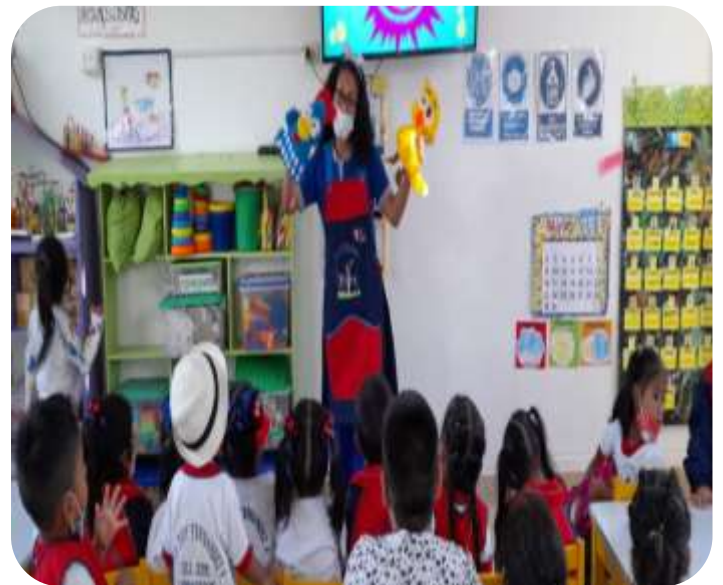
Se realizó la actividad “Aprendemos los colores con la gallina pintadita”