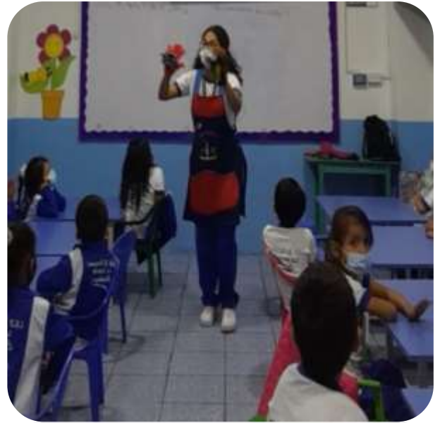
Se realizó la actividad “Cantamos los cinco ratoncitos”