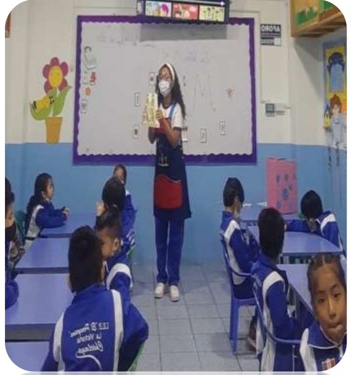
Se realizó la actividad "Aprendemos cantando la consonante M"