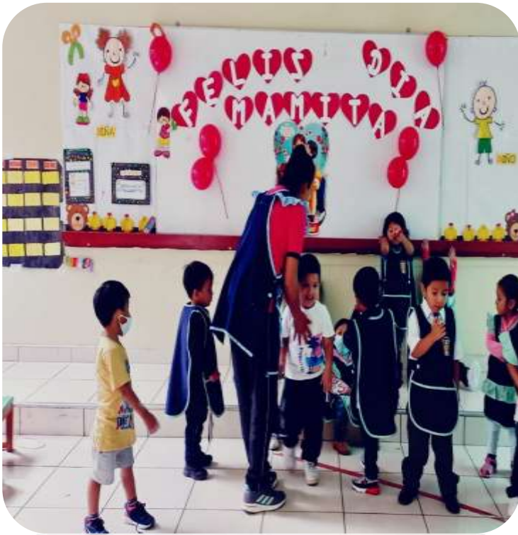
Se realizó la actividad "Cantamos a mamá"