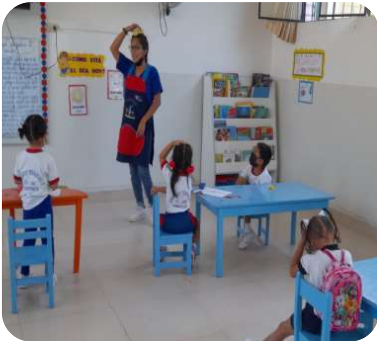
Se realizó la actividad "El gusanito y la lengua cantora"