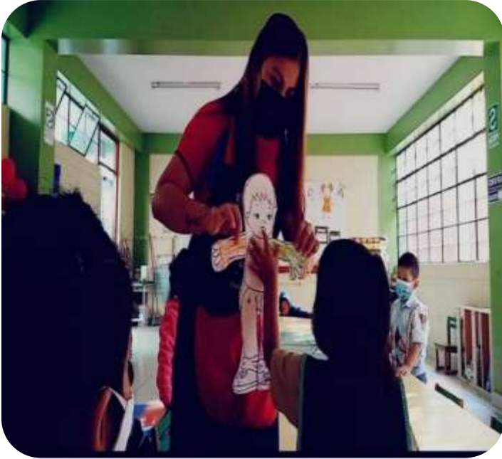
Se realizó la actividad “Conocemos nuestro cuerpo cantando”