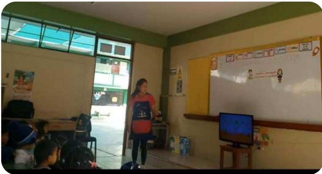
Se realizó la actividad "El canticuento de los tres chanchitos"