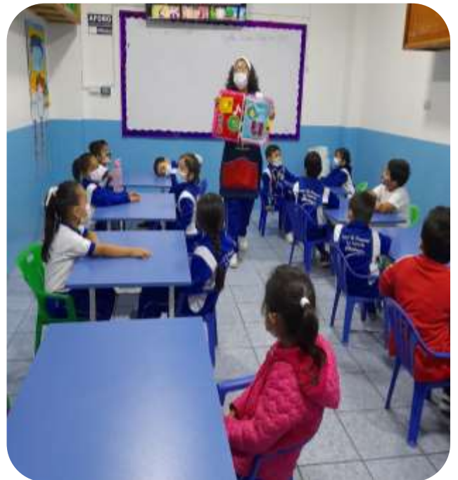
Se realizó la actividad "Nos divertimos entonando las vocales"