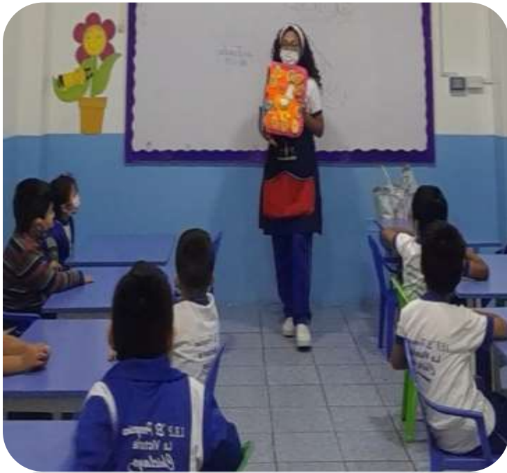
Se realizó la actividad "Cantamos con los números"