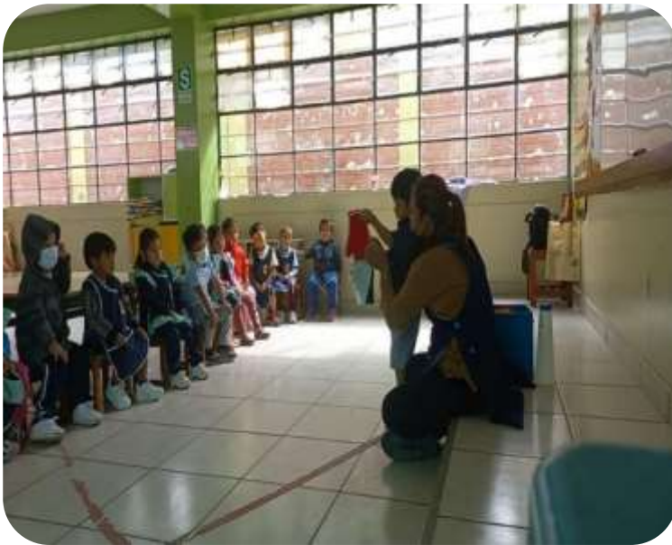
Se realizó la actividad “Conocemos los sentidos cantando”