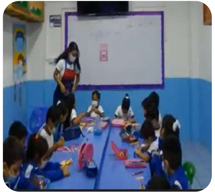
Se realizó la actividad "Nos expresamos dibujando"