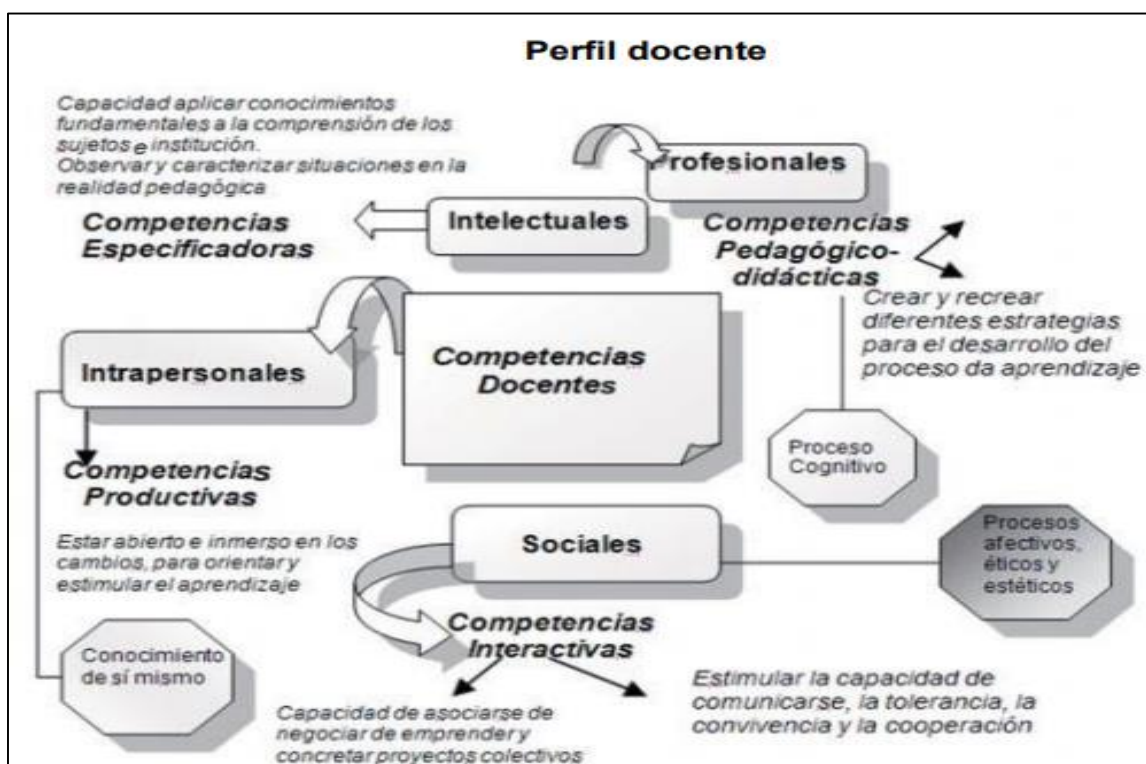
Modelo de perfil docente