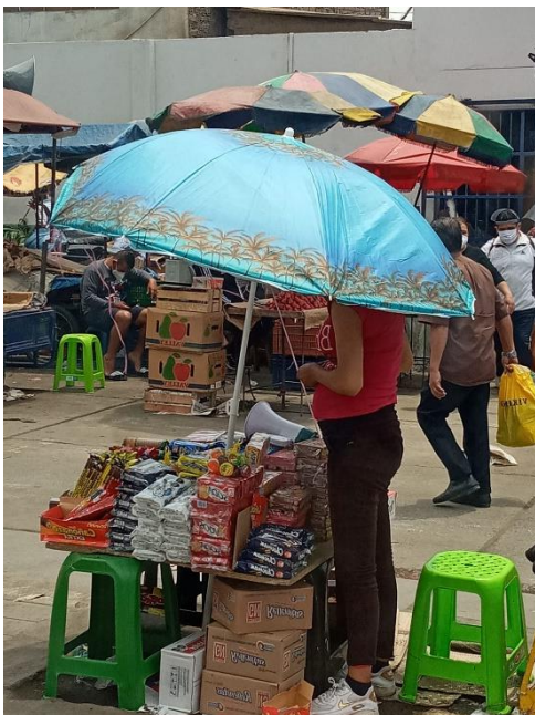
Figura 2. Autor: Mishell Miñano

Haciendo referencia al color, se logró evidenciar dentro del material fotográfico que cuatro de ellas presentaban manipulación en cuanto a saturación, equilibrio y temperatura, por otra parte, en contraste, se logró observar en una de ellas, que la imagen fue presentada de forma natural sin ningún tratamiento (Figura 2).