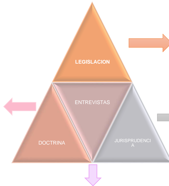
GRAFICO 05: TRIANGULACIÓN DE DATOS

La doctrina señala que el principio de Ultima Ratio conduce a una exigencia de utilidad, considerando el empleo de la pena en casos resulten necesarios e imprescindibles, de manera contraria nos encontraremos ante una lesión que se podría considerar inútil a los derechos fundamentales. penalizar estos delitos nos lleva a definir que entendemos por penalización, para la doctrina, es el hecho por el cual se asigna una sanción a una conducta generadora de daño, esta conducta resulta ser reprochable jurídicamente.