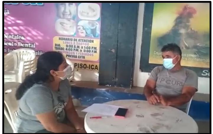
Entrevistado N° 2