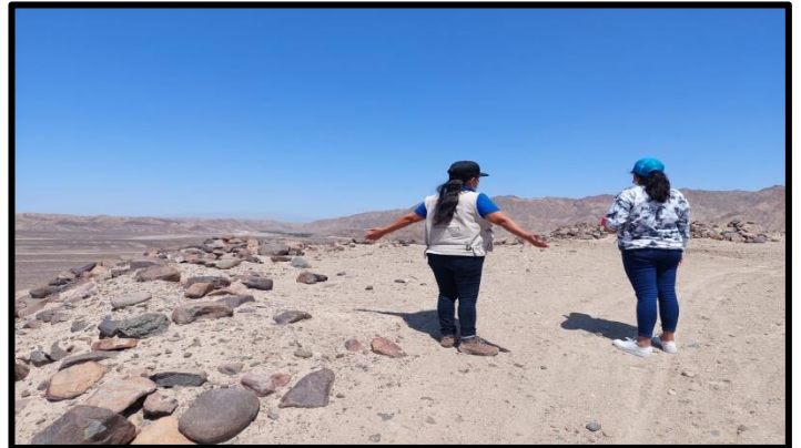
Entrevistado N° 4