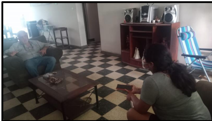
Entrevistado N° 3