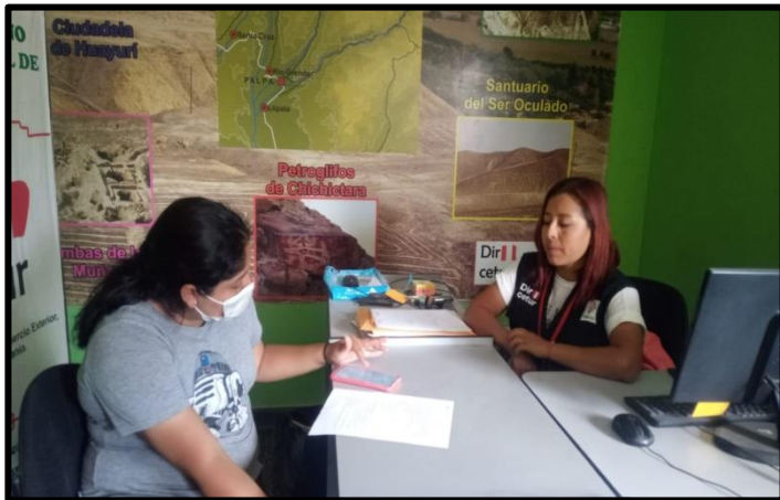
Entrevistado N° 1