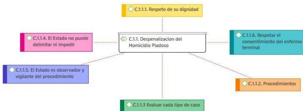
Categoría 1 Despenalización del homicidio piadoso