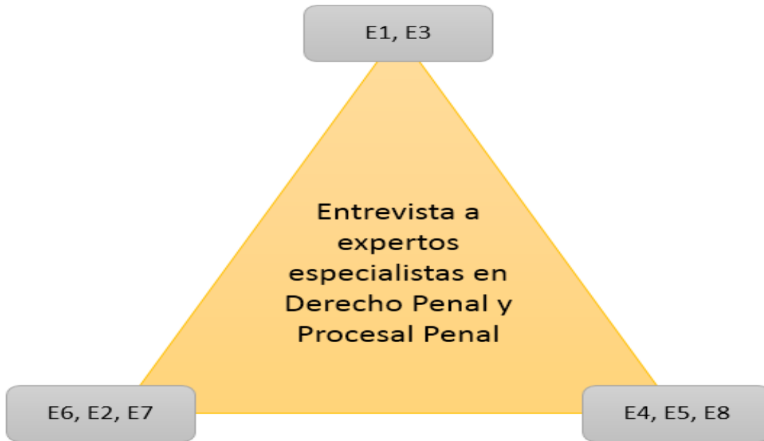
Figura 2 Triangulación de Entrevista de Expertos