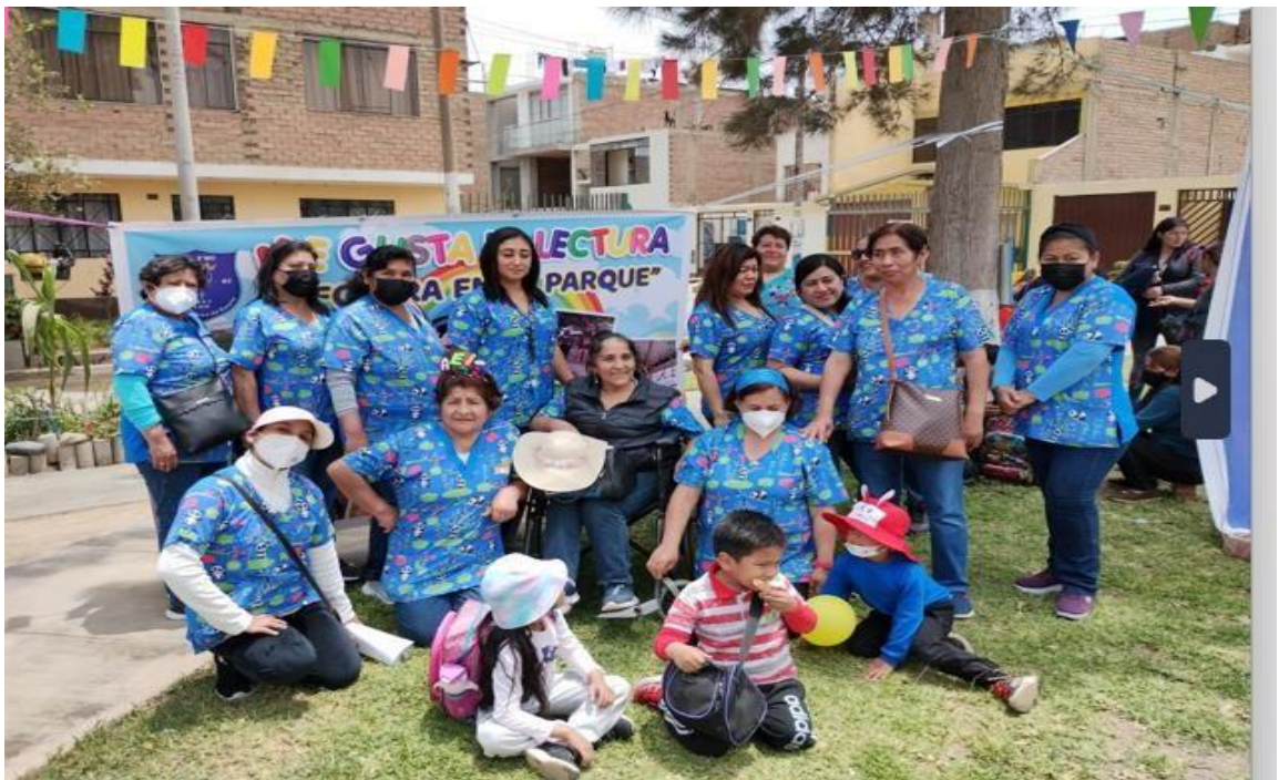
TODOS PARTICIPARON CON ALEGRÍA Y ENTUSIASMO. ¡GRACIAS IEI 003!