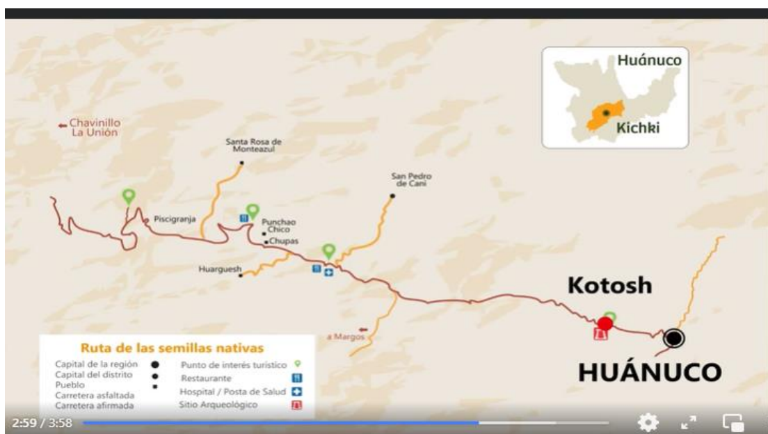
Figura 23. Ruta de semillas nativas de Kichki