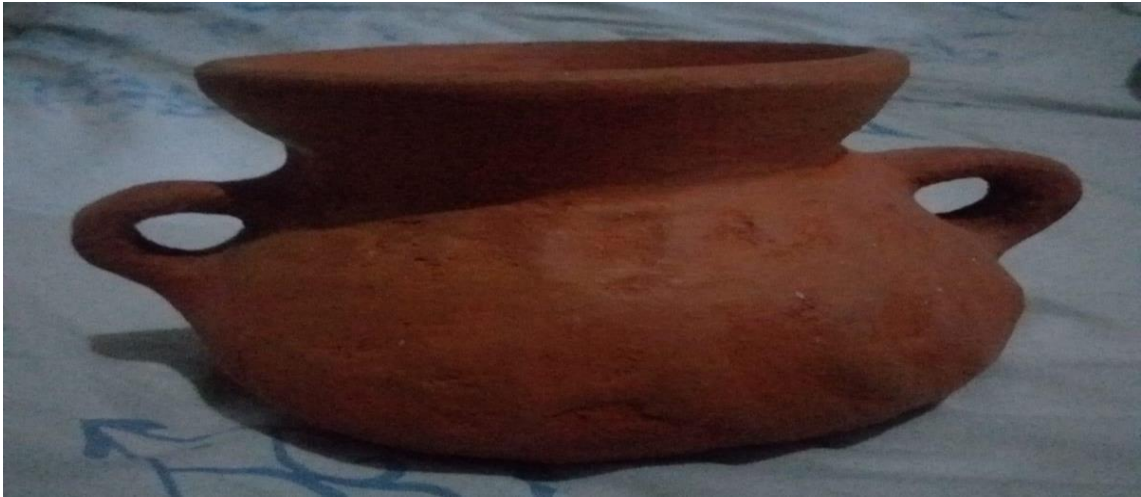
Figura 14. Cerámico de barro