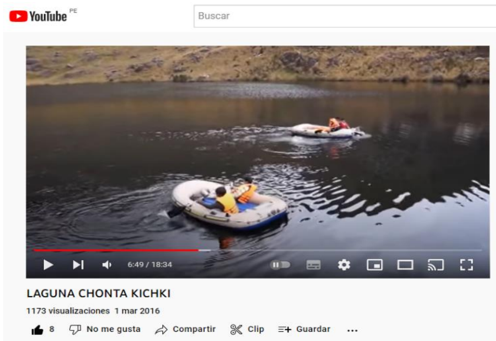
Figura 22. Publicidad de Laguna Chonta