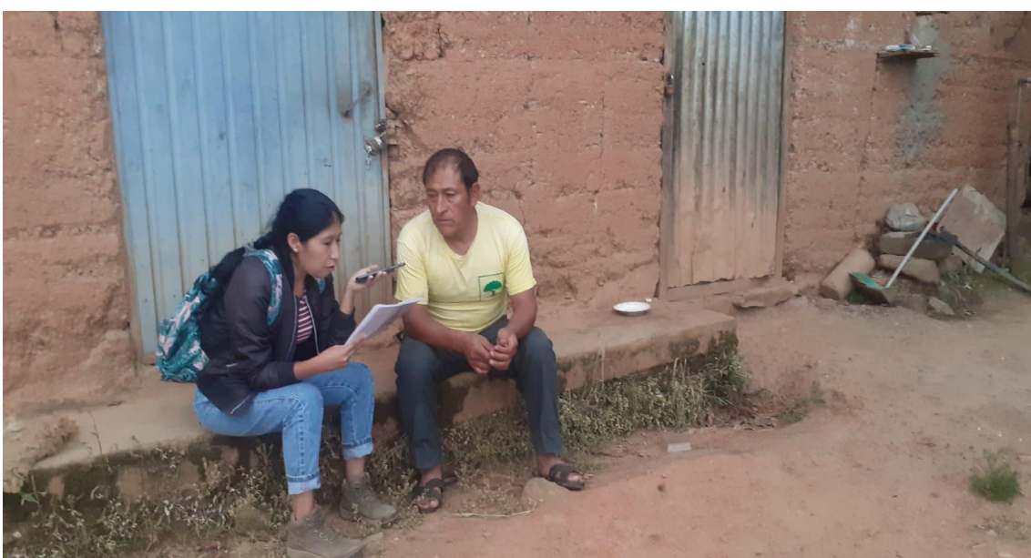
Figura 7. Entrevista al presidente comunal de San Pedro de Cani