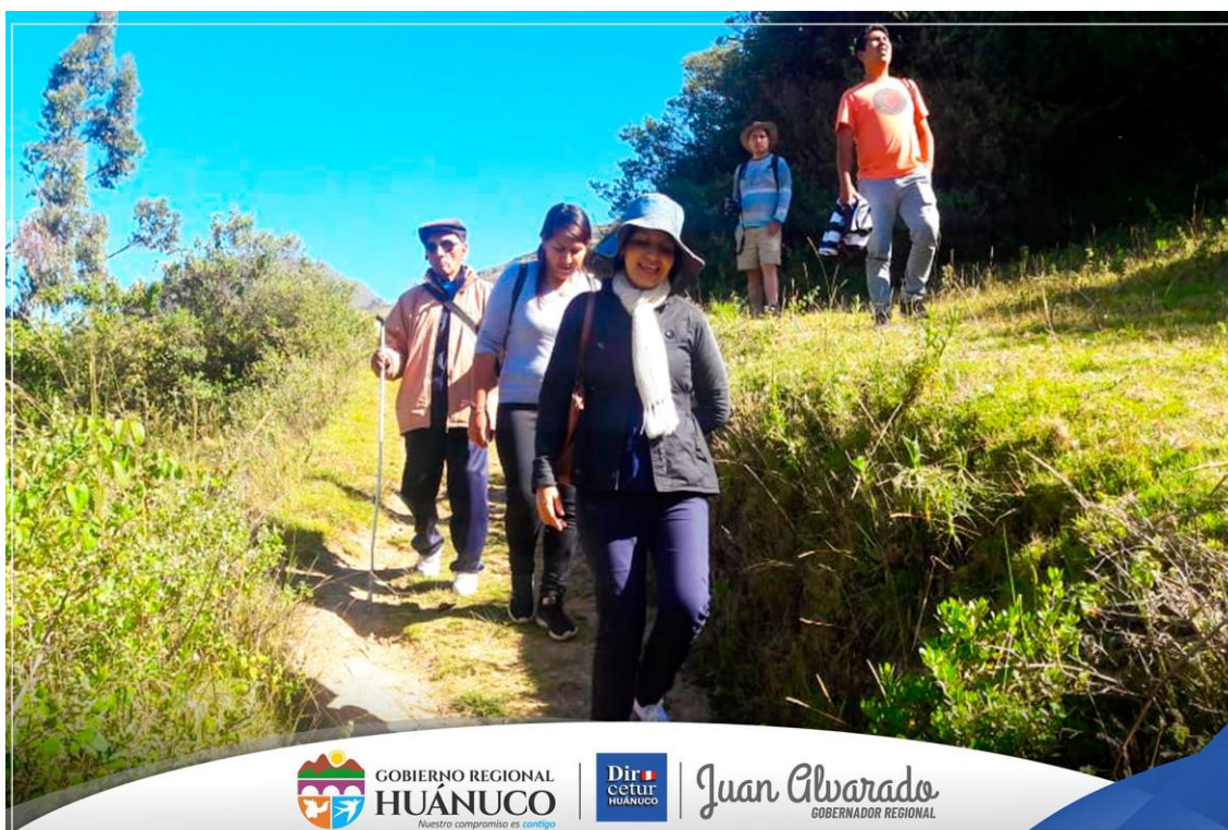
Figura 20. Visita turística a la ruta de Semillas Nativas