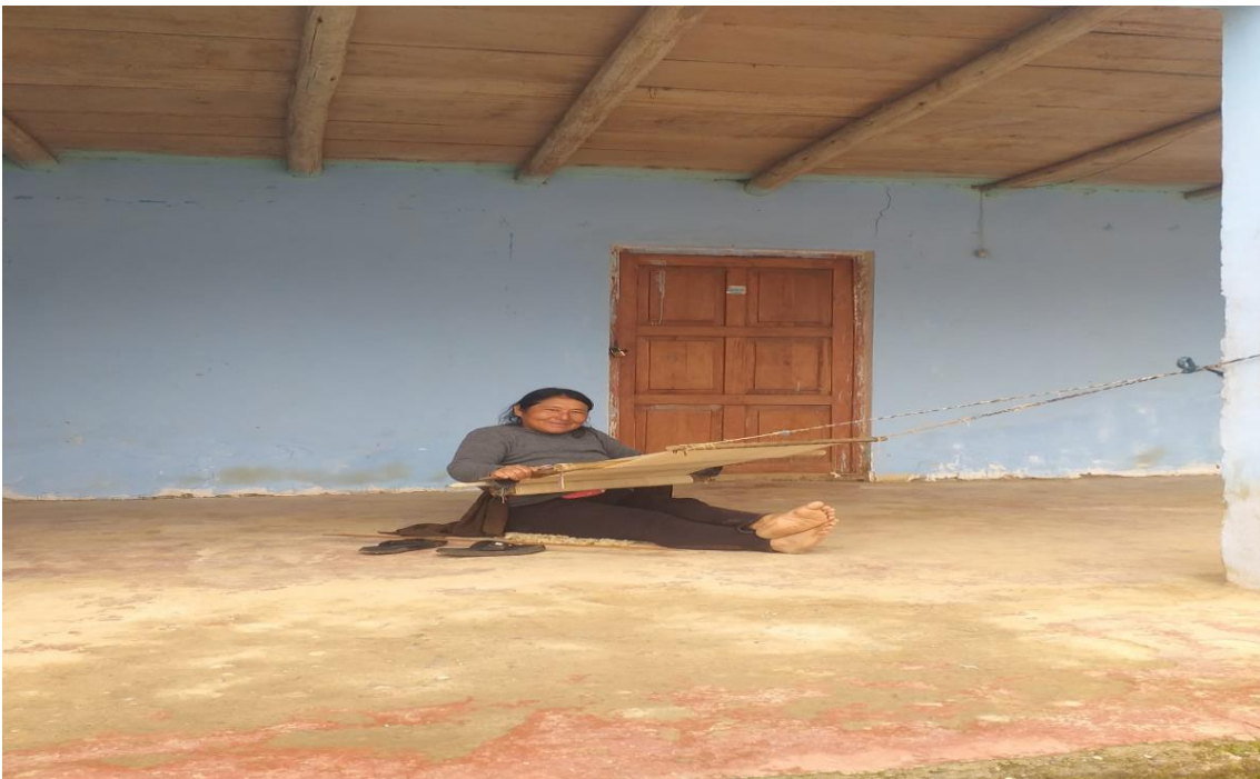
Figura 11. Taller de tejidos a mano