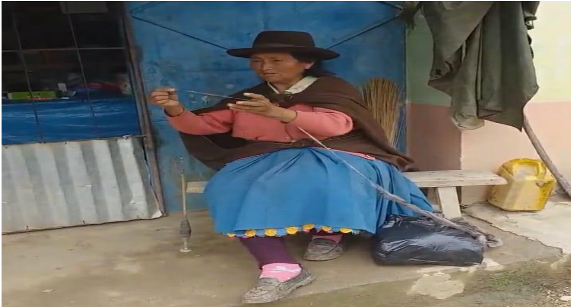
Figura 10. Taller de tejido a mano