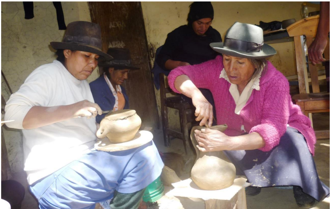
Figura 15. Taller de artesanía