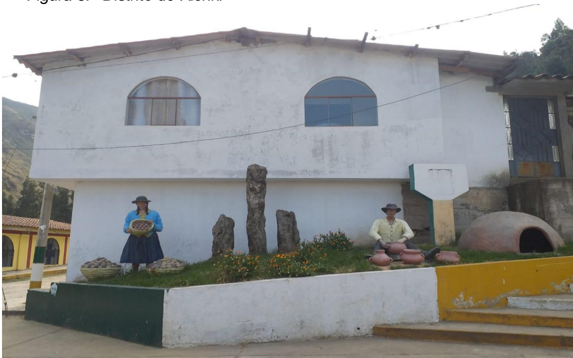
Figura 6. Distrito de Kichki