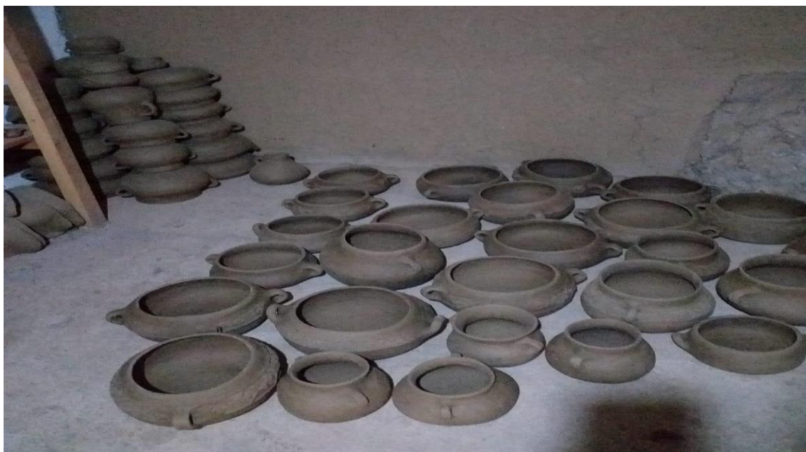
Figura 13. Taller de artesanía