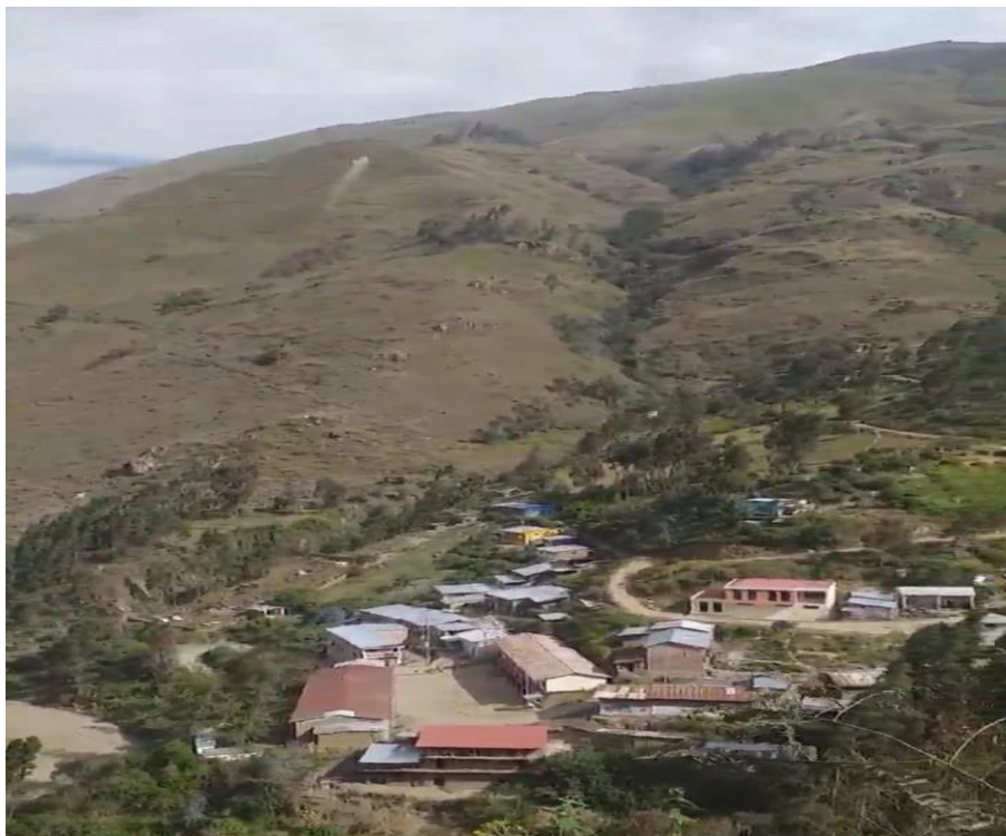
Figura 17. Comunidad de Huarguesh