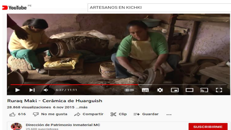
Figura 21. Publicidad de artesanía en Kichki