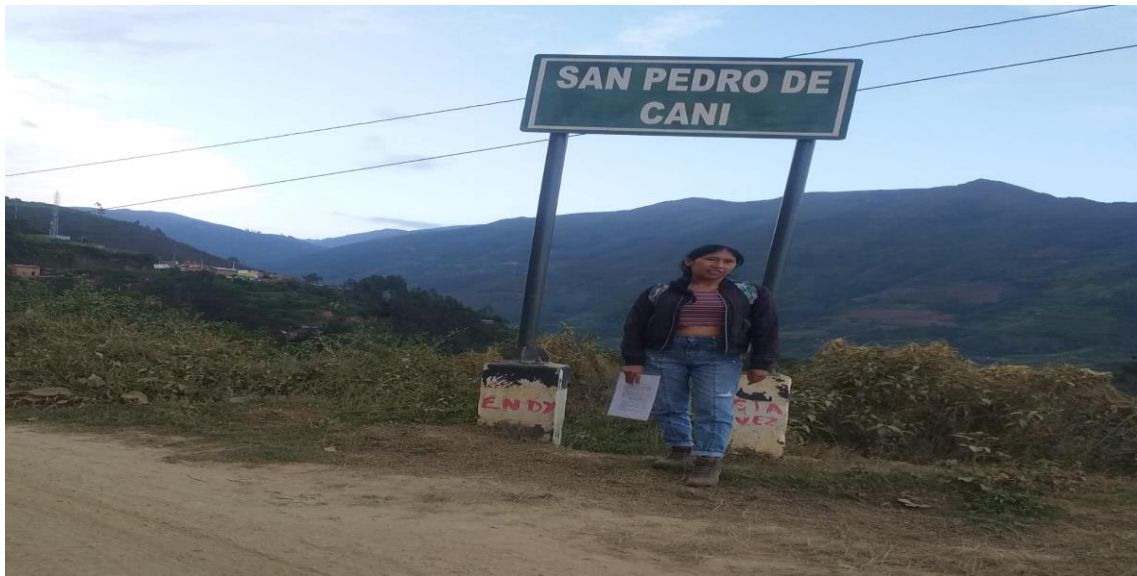
Figura 16. Comunidad de San Pedro de Cani