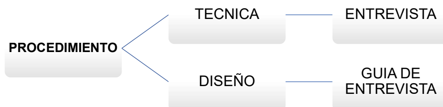
Tabla Nº 3. Procedimiento.

El procedimiento propuesto para la obtención de la información necesaria para el presente trabajo de investigación, en primer lugar, el procedimiento se enfoca en la definición del problema, el cual se obtiene analizando documentos en libros, artículos científicos de revistas indexadas nacionales e internacionales y casos de tribunales internacionales sobre la materia; esto nos brinda la base teórica para poder sintetizar en consecuencia y conceptualizar las categorías y subcategorías de la investigación que se realizó. Luego se procedió a solicitar la colaboración de expertos con el fin de que brinden opiniones con sus aportes críticos y fundamentados con respecto a la materia en estudio; para lo anterior se procedió a la validación de las herramientas de recolección de datos con la ayuda de expertos científicos, con el que se tuvo como finalidad la validez del instrumento y la confiabilidad, seguidamente se procedió a las entrevistas, de manera virtual y presencial y finalmente concluimos con la recolección y sistematización de la información recabada de las entrevistas a expertos en respuesta a los objetivos en estudio.