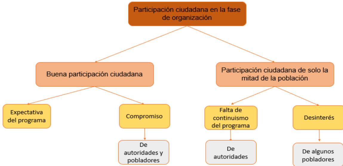
Figura 2 Red sistemática del eje temático participación ciudadana en la fase de organización.

En cuanto al eje temático participación ciudadana en la fase de planificación con su sub eje programación de estrategias, se encontró que los trabajadores municipales percibieron poca participación de la población por falta de compromiso, falta de tiempo, poca inversión económica por parte de la municipalidad para el programa, desinterés y falta de empatía de los pobladores; dejando a las autoridades, trabajadores municipales y equipo multisectorial el trabajo de planificar las actividades y talleres de la fase de planificación del programa; mientras que el grupo de ciudadanos que participan lo hacen por la facilidad que implica este trabajo dado que se cuenta con los anteproyectos del programa, así también porque quieren ser beneficiarios del programa y sus talleres; así mismo conoció que hay una diferencia en la participación por grupo etario.