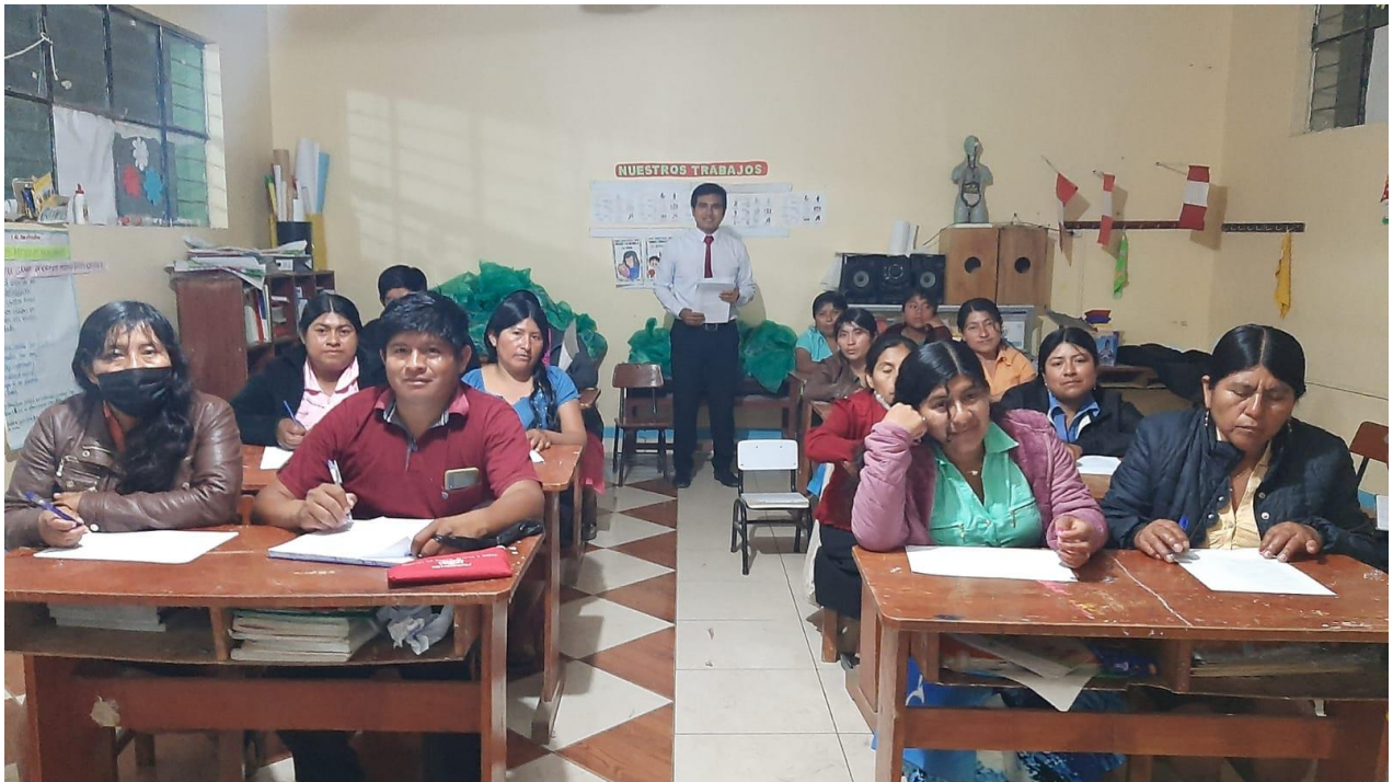
FOTO: Aplicación de las encuestas a los beneficiarios de Qali Warma.