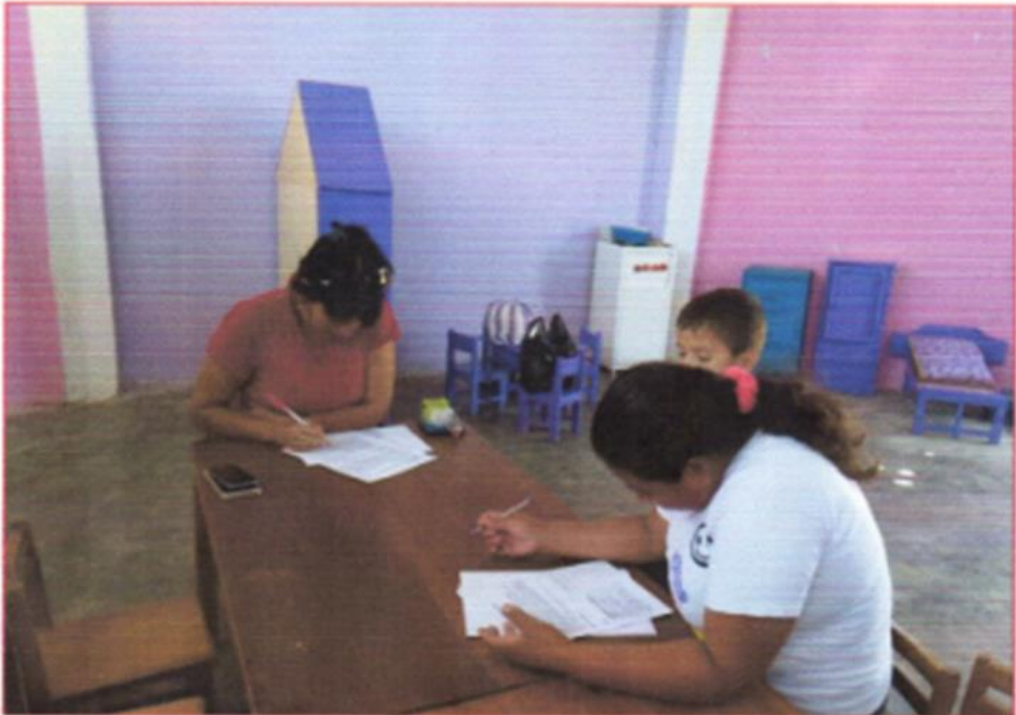
INSTITUCIÓN EDUCATIVA INICIAL N°090 KM. 50