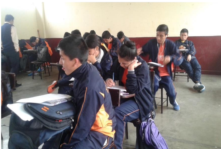
Nota: Aplicación de la encuesta a los estudiantes del quinto año "F" de secundaria del colegio Gustavo Ríos