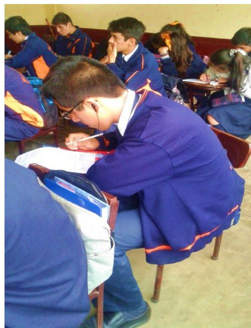
Nota: Aplicación de la encuesta a los estudiantes del quinto año "B" de secundaria del colegio Gustavo Ríos