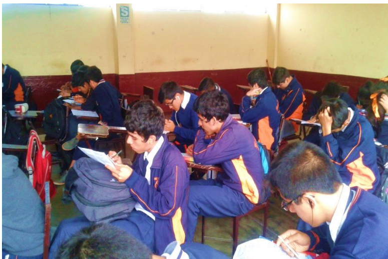
Nota: Aplicación de la encuesta a los estudiantes del quinto año "E" de secundaria del colegio Gustavo Ríos