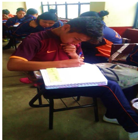
Nota: Aplicación de la encuesta a los estudiantes del quinto año "A" de secundaria del colegio Gustavo Ríos