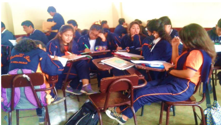
Nota: Aplicación de la encuesta a los estudiantes del quinto año "D" de secundaria del colegio Gustavo Ríos