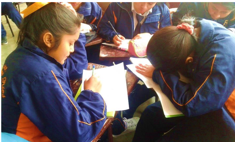
Nota: Aplicación de la encuesta a los estudiantes del quinto año "C" de secundaria del colegio Gustavo Ríos