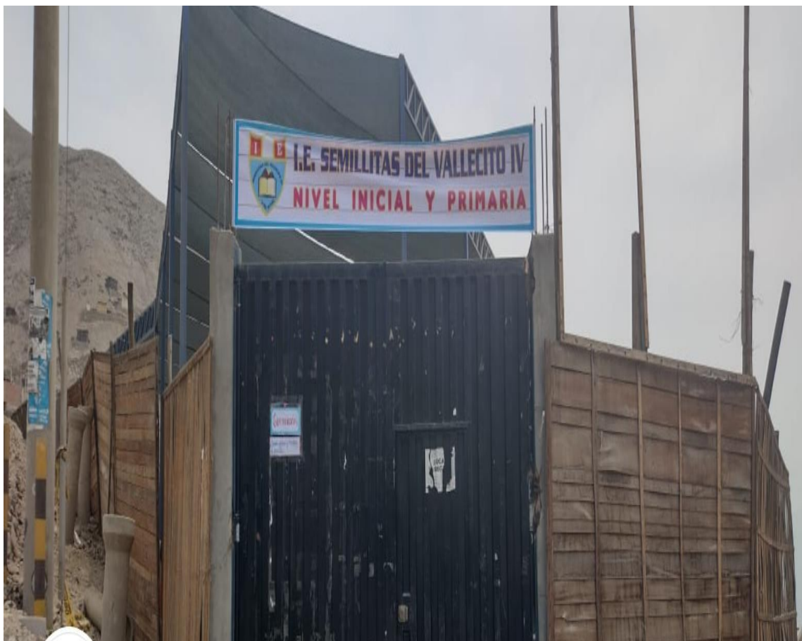
Colegio: "Semillitas del Vallecito IV"