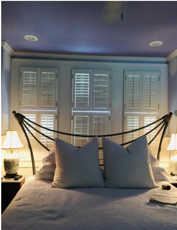
Nota. Mala ubicación de muebles