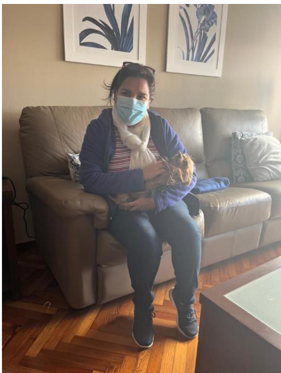
Vista interior de sala