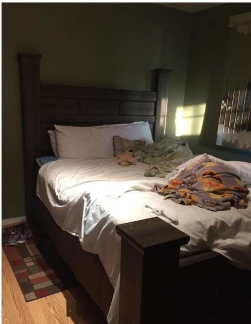
Nota. Colores oscuros y mobiliario pesado