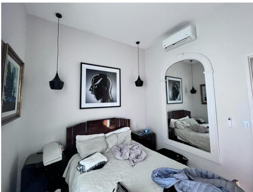
Vista interior de dormitorio 4

Nota. Adecuado mobiliario y color de muebles y pared, techo y piso