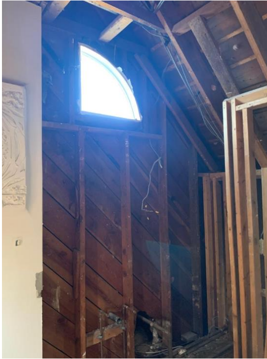
Vista interior de baño