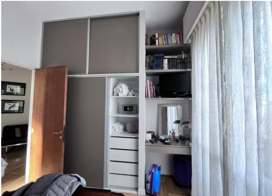
Vista interior de dormitorio 3

Nota. Adecuado mobiliario y color de muebles y pared, techo y piso