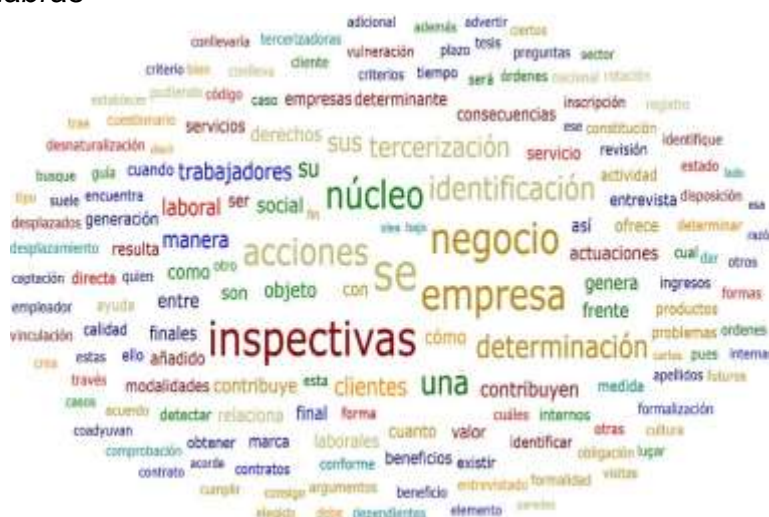
Figura 4: Nube de palabras

En la figura 4 se observa que los participantes han coincidido en el uso con mayor frecuencia, tales como los términos inspectivas, determinación, empresa, negocio, núcleo, acciones, tercerización, identificación, coadyuvando de esta manera a los fines que persigue la investigación.