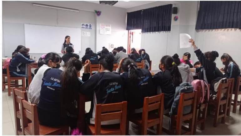
I.E Santa María de Miramar