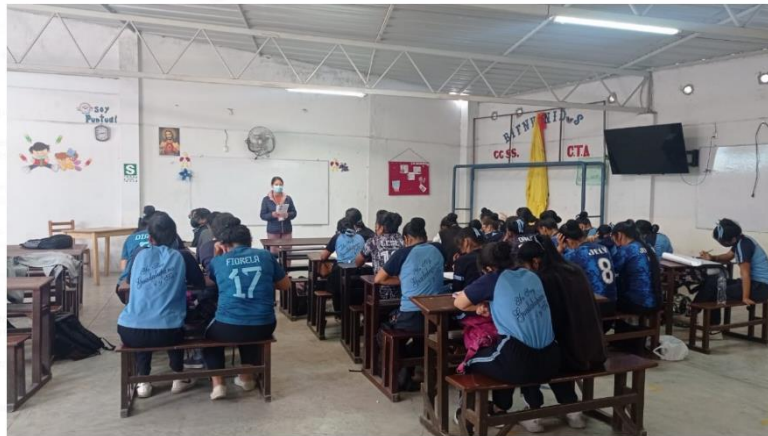
Colegio Guadalupe de Miramar