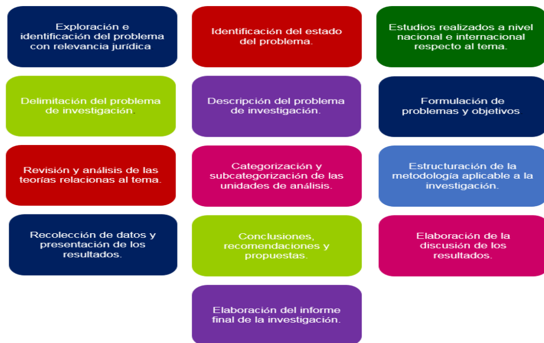
Figura 1. Trayectoria metodológica

Con relación al procedimiento del trabajo de campo se realizó una previa coordinación con los entrevistados; para explicarles la razón de la visita y la relevancia de su participación en la presente investigación, en relación con la condena no pronunciada y el principio constitucional de igualdad ante la ley.