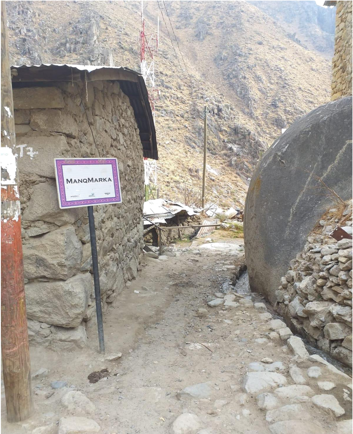
Figura 11: Caminos señalizados en Jaqaru