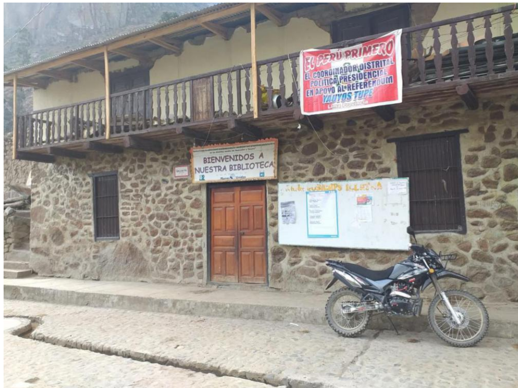
Figura 10: Biblioteca distrital