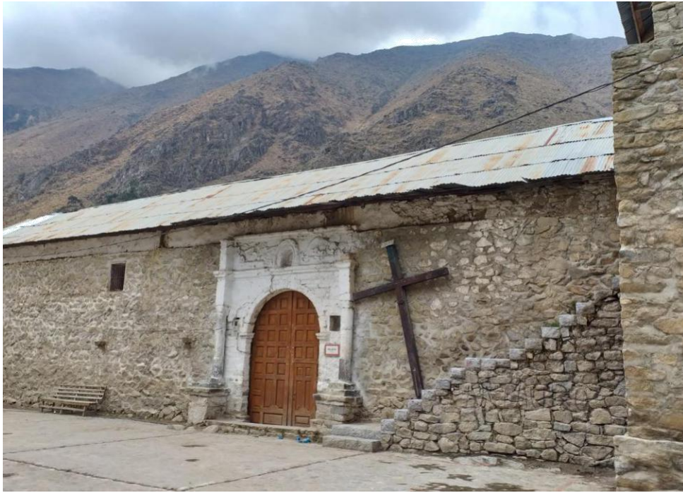
Figura 6 : Iglesia del distrito de Tupe