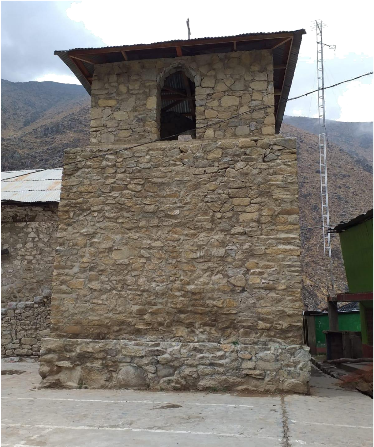
Figura 8 : Campanario de la iglesia, sirve como llamado a los pobladores cuando se requiere de alguna reunión