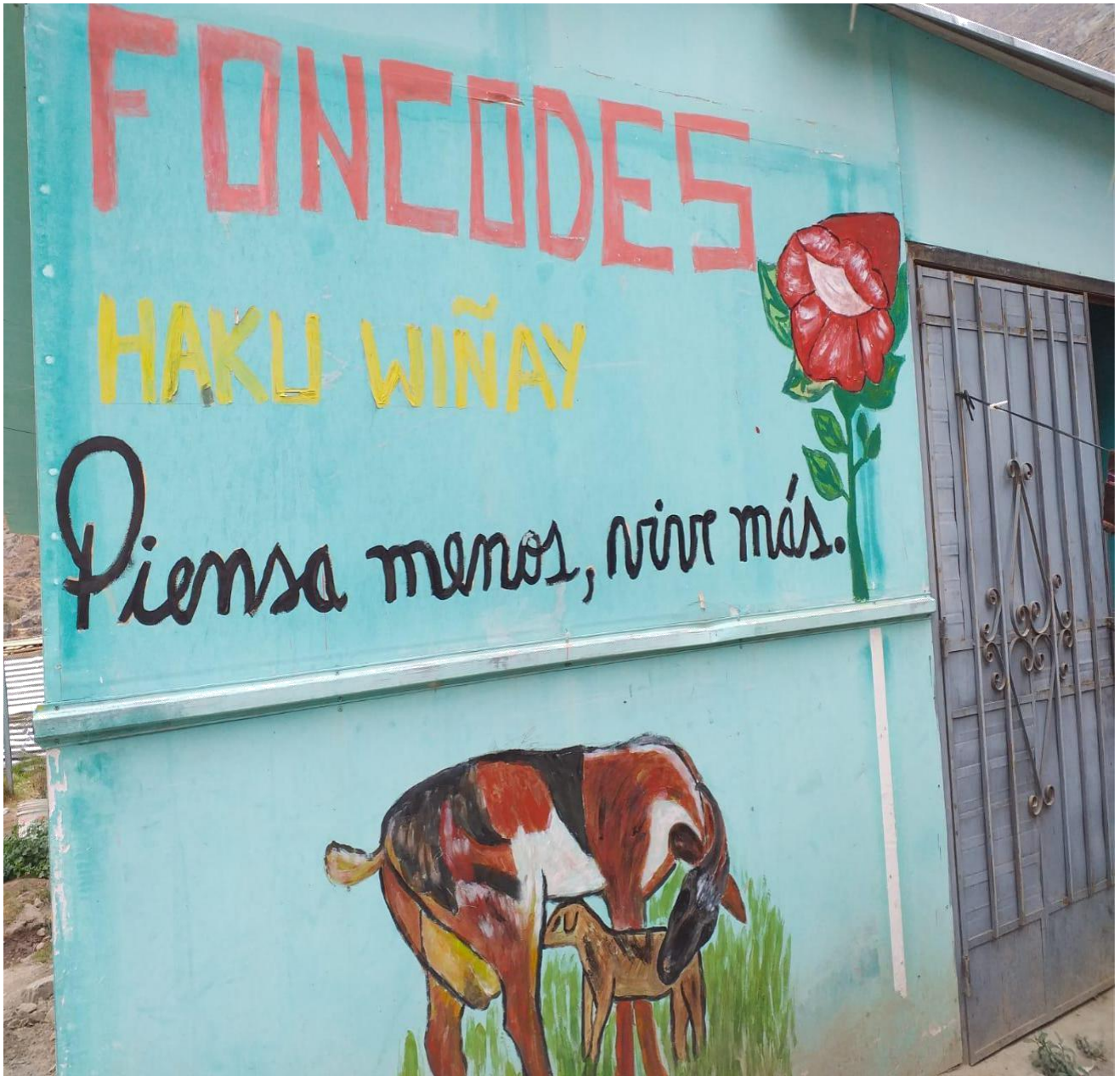
Figura 16: FONCODES, siendo partícipe de cooperación en el distrito de Tupe