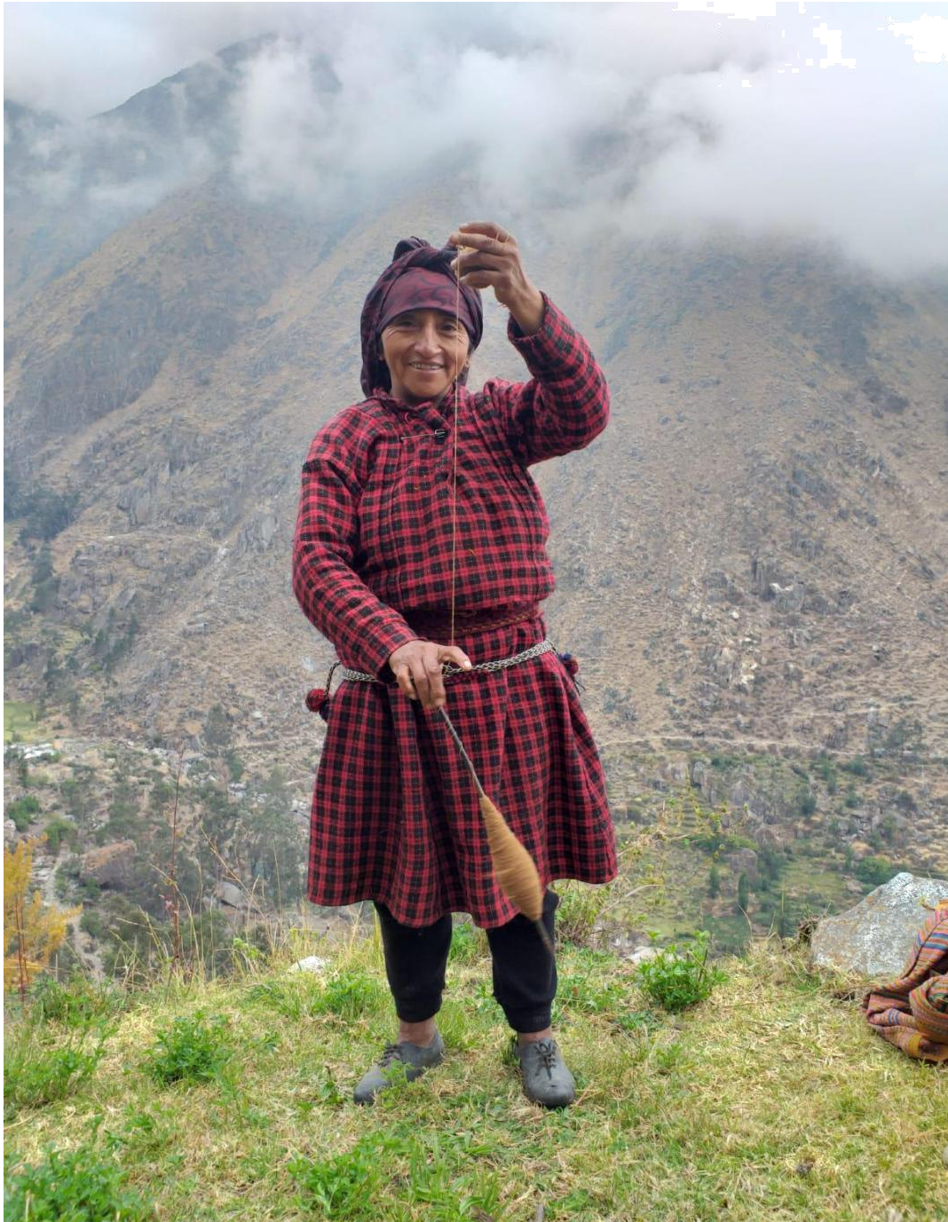
Figura 1 : Hilando merino para el uso de una faja