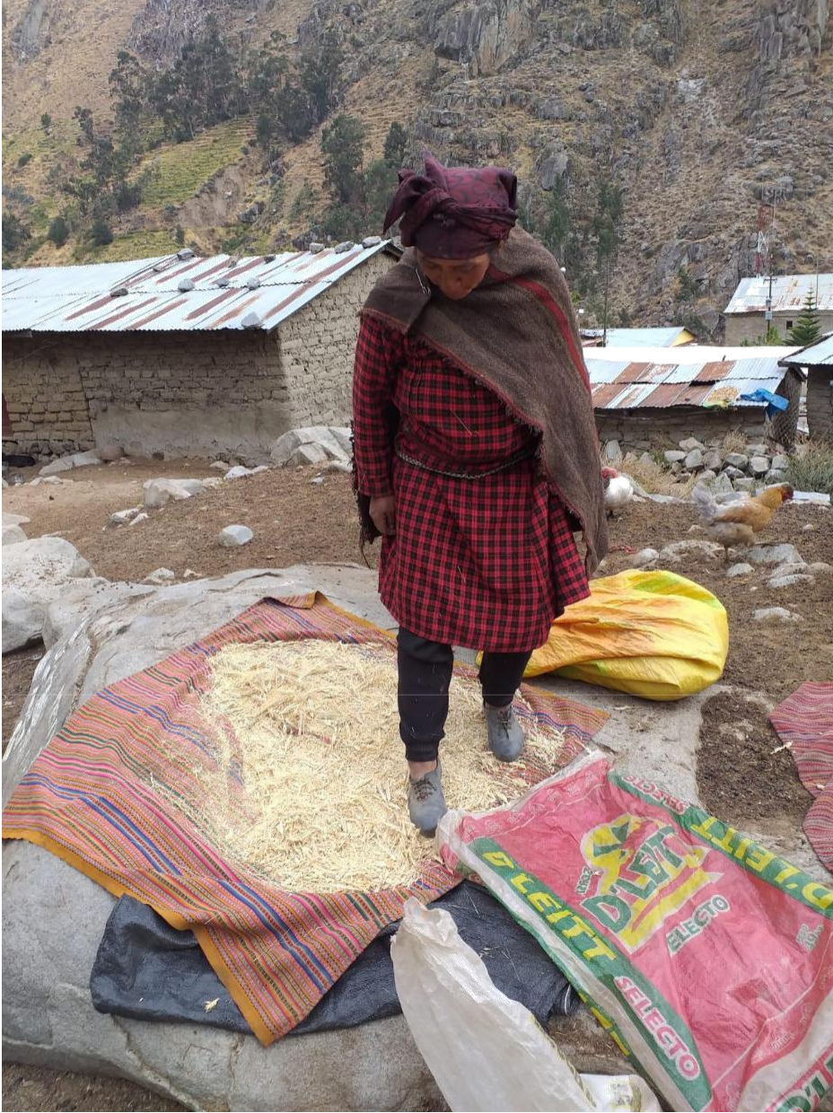
Figura 12: Pobladora trillando cebada