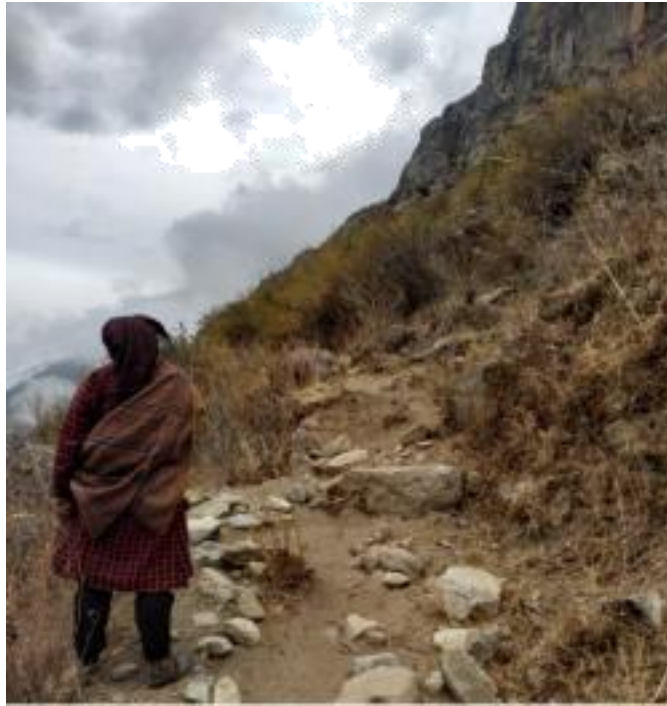
Figura 14: Camino al cerro Tupinachaca