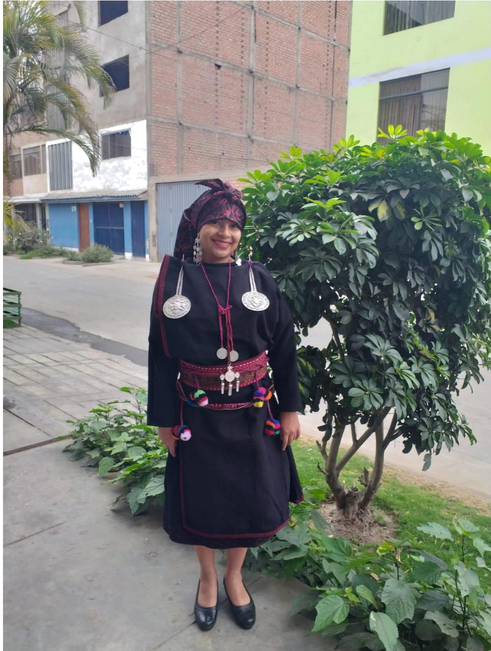
Figura 4 : Demostración del traje más elegante del distrito, “Anaco”