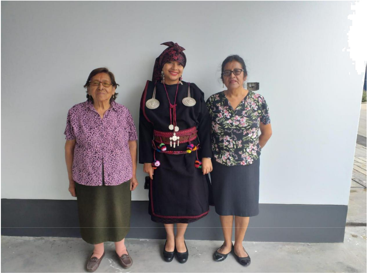
Figura 5 : Vestimenta del Anaco junto a profesoras del idioma Jaqaru