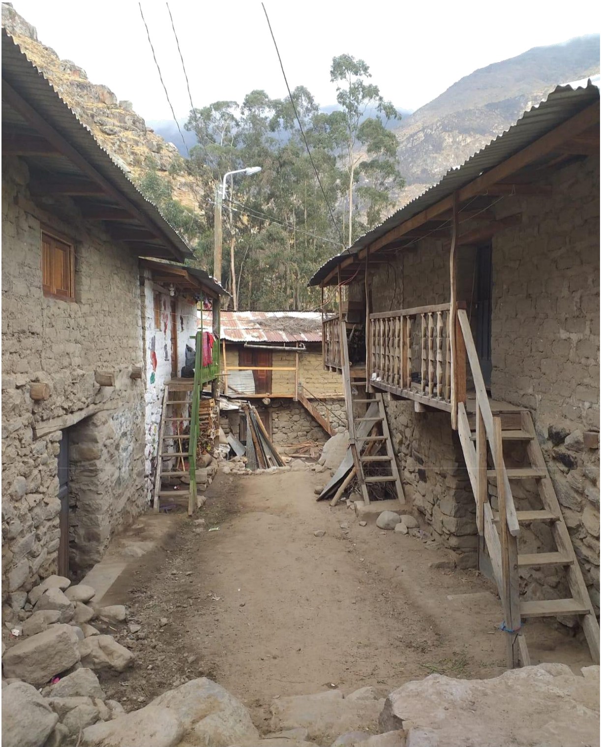
Figura 13: Calles peculiares de este distrito