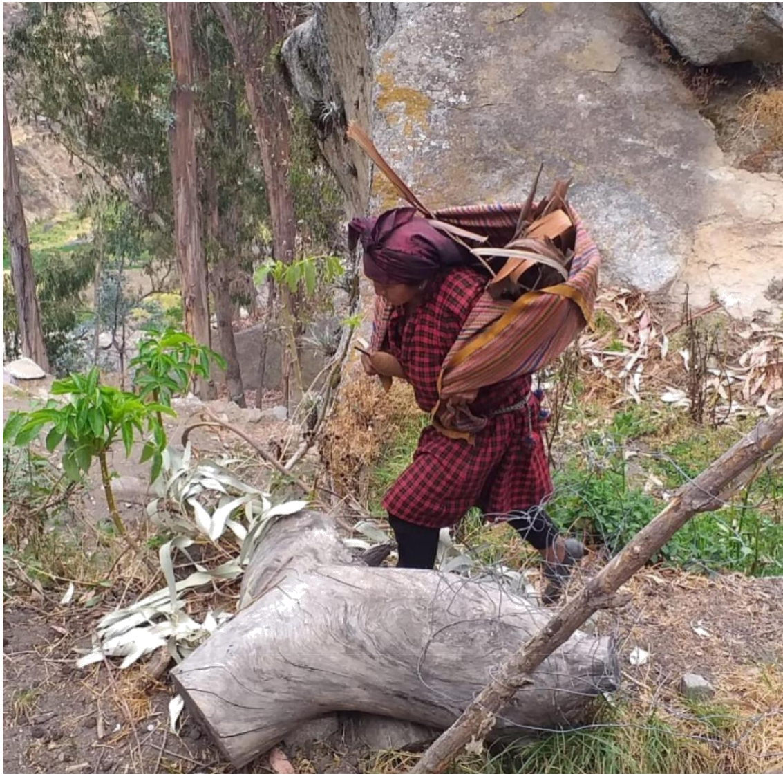
Figura 2 : Pobladora llevando leña para cocinar