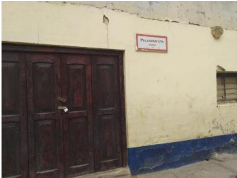
Figura 9 : Comedor del distrito