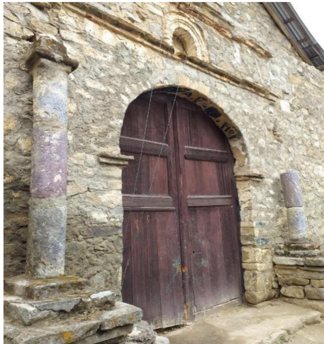
Figura 7 : Entrada trasera de iglesia