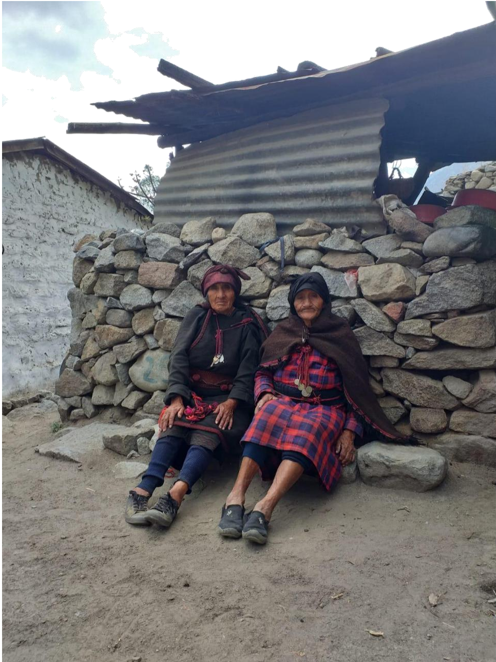
Figura 3 : Un día cualquiera por la tarde