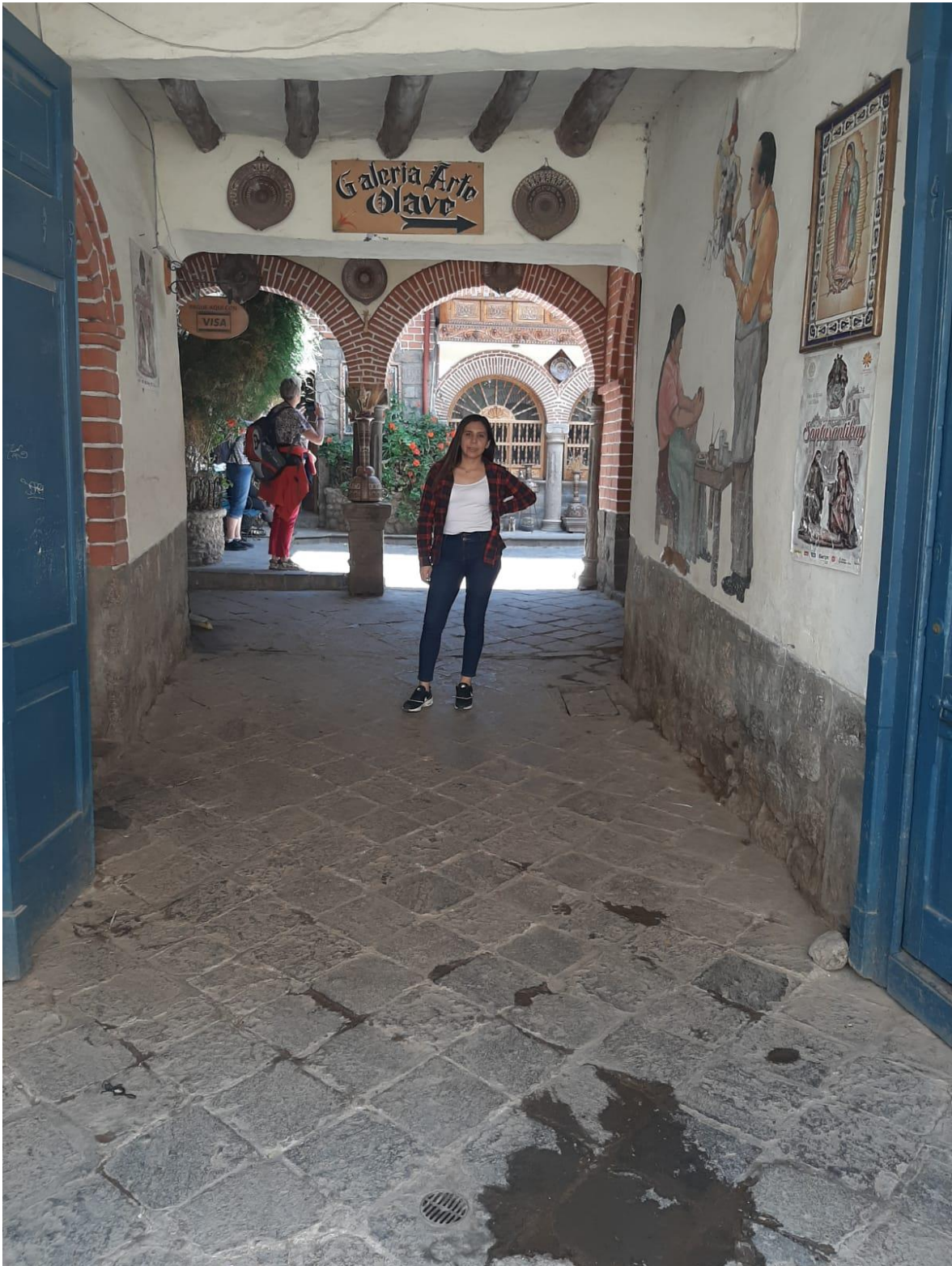
Figura 8: Foto del investigador de la galería arte Olave