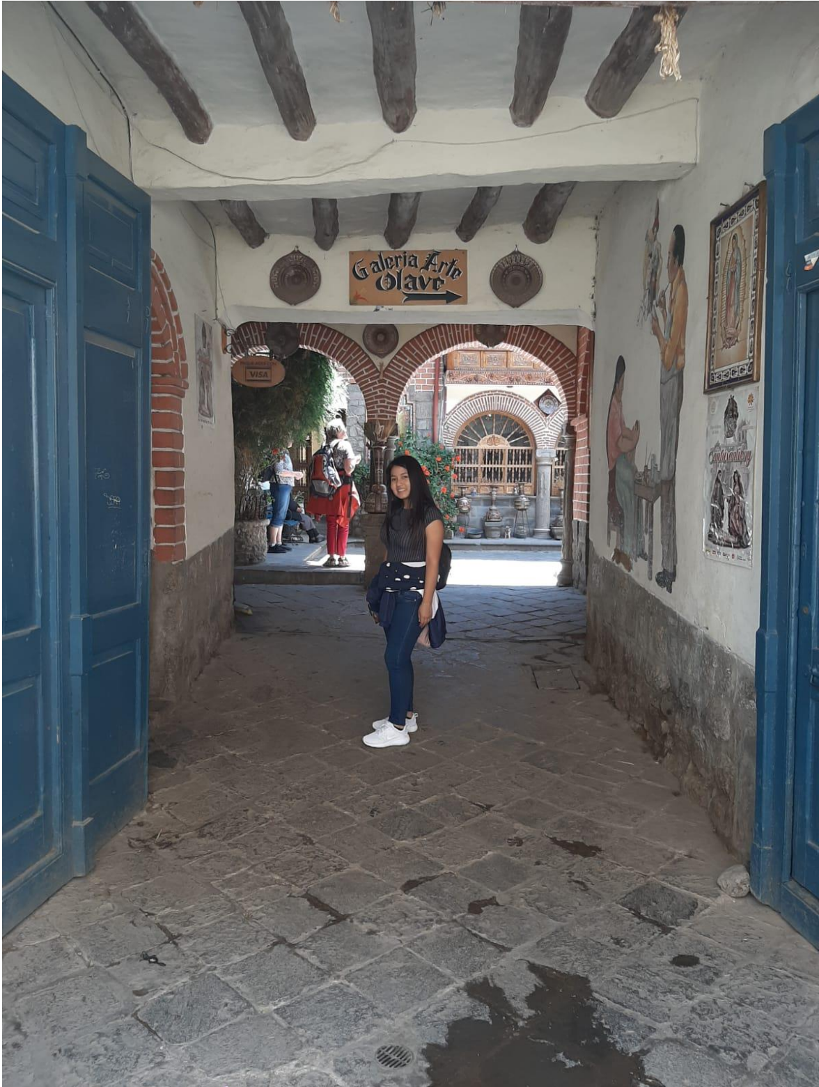
Figura 7: Foto del investigador de la galería arte Olave