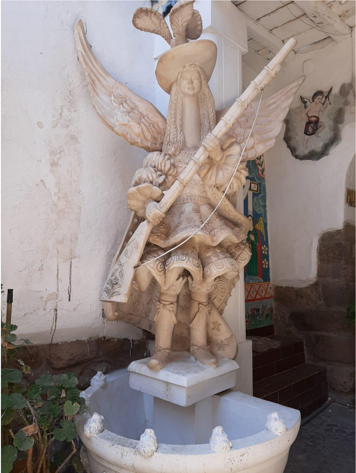
Figura 4: Foto del investigador del museo taller Hilario Mendivil