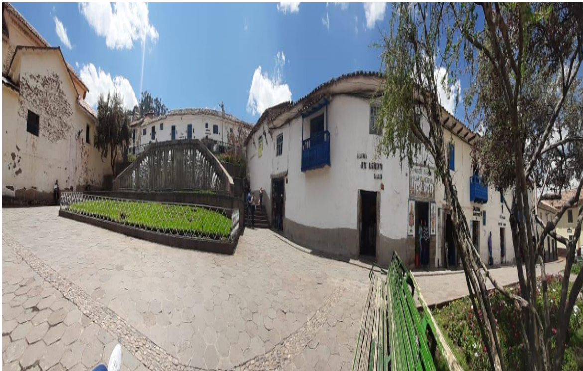
Figura 1: Foto del investigador de la plaza de San Blas, Cusco