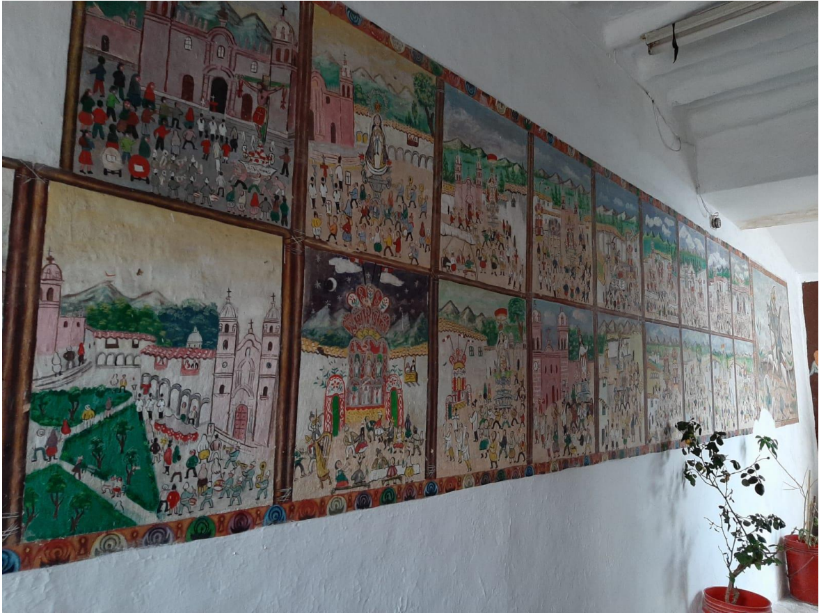
Figura 2: Foto del investigador del museo taller Hilario Mendívil