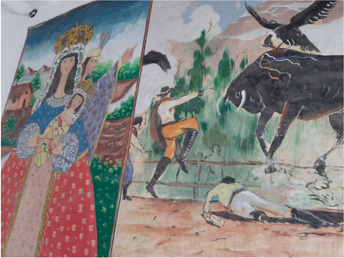
Figura 3: Foto del investigador del museo taller Hilario Mendivil