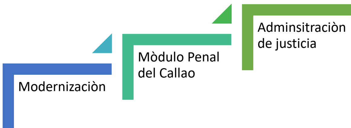
Figura 1. Proceso: gestión judicial (elaboración propia)