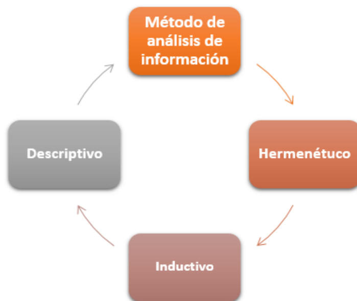
Figura 1: Método de análisis de la información

fortalecer nuestro trabajo; inductivo , porque nuestro punto de partida es el desarrollo teórico de nuestras categorías y seguidamente con la opinión de los especialistas en base a ejercicios de subsunción y descriptivo , porque vamos a analizar cada uno de los aspectos mencionados.