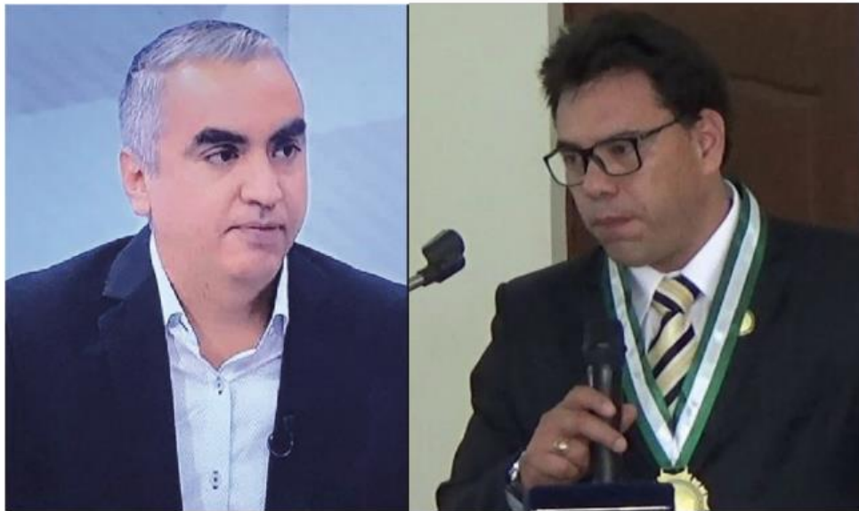
Mazzei Foto detalló indicación de Rocha Arista ante fiscal González.