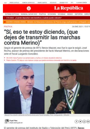
Figura 6: “Sí, eso te estoy diciendo, (que dejes de transmitir las marchas contra Merino)”.

Siguiendo con el tercer objetivo específico se planteó lo siguiente: Identificar la técnica falacia en el caso del ex presidente Manuel Merino de Lama, según el diario La República. En base a este objetivo se encontró similitudes en las subcategorías, como en las falacias de atinencia donde Renzo Mazzei brindó razones para poder creer en sus declaraciones, de igual manera en la subcategoría falacia de ambigüedad porque en esta nota informativa Renzo Mazzei da declaraciones las cuales pudieron ser interpretadas de distintas maneras.