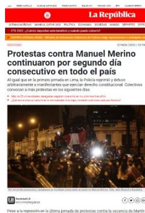
Figura 1: “Protestas contra Manuel Merino continuaron por segundo día consecutivo en todo el país”.