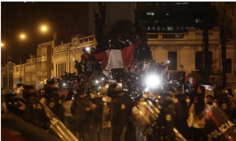
Por tercer día consecutivo, ciudadanos se movilizan contra toma de poder de Manuel Merino.