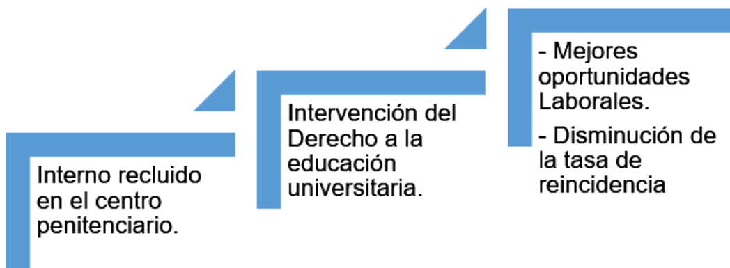
Figura N° 02 – Gráfico sobre la intervención de la educación universitaria como resocialización del interno.

Para afianzar mejor lo antes mencionado y graficar lo expuesto, es que se ilustra el siguiente gráfico: