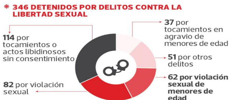
figura 2 denuncias contra la libertad sexual en el año 2020