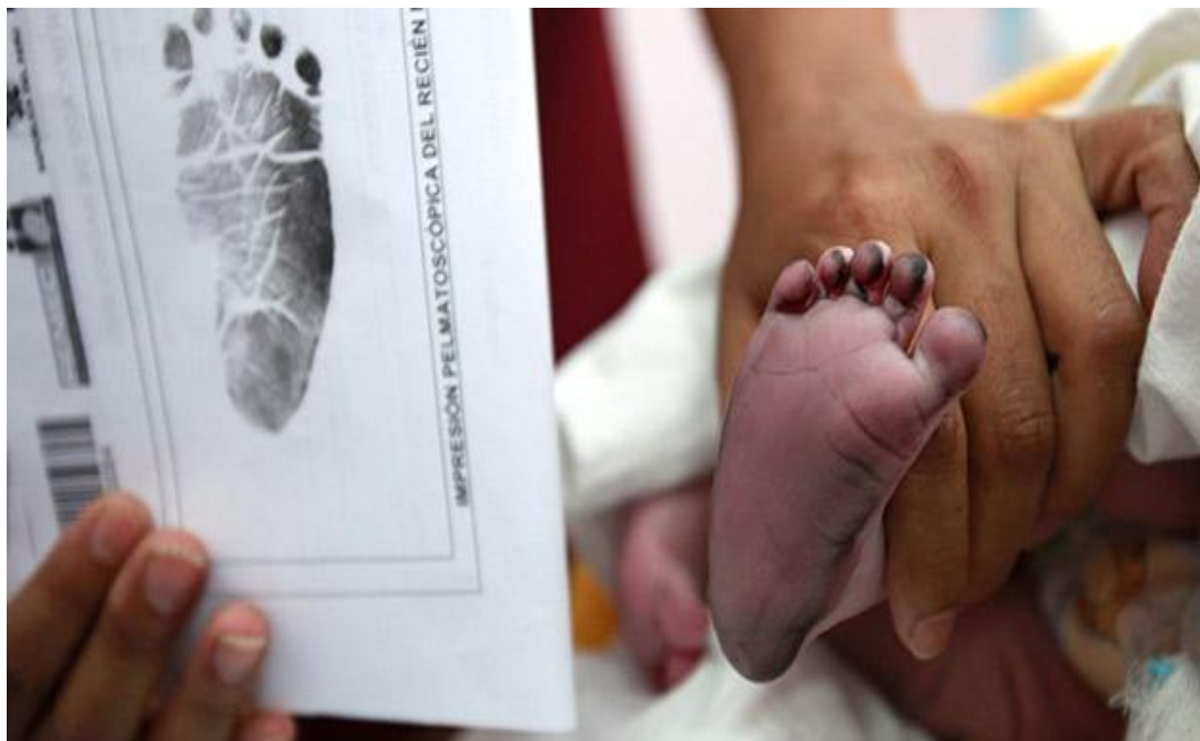
Figura 3: Captura de la huella pelmastocópica del recién nacido

Acta de Nacimiento y su posterior inscripción en el registro de identificación civil, para la obtención del Documento Nacional de Identificación (DNI), expedido por el Registro Nacional de Identificación y Estado Civil (Reniec).