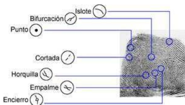
Figura 1: Características de la huella digital Nota: Delgado (s.f.)

posee un alto nivel de exactitud toda vez que es un única y no existe dos o más individuos que poseen éstas con similitud. Para su lectura existen dos métodos siendo el primero basado en minucias (Fig. 1), el mismo que consiste en la observación de algunos detalles característicos fácilmente identificables y el segundo método basado en correlación (Fig. 2) el cual se estudia la huella en general.