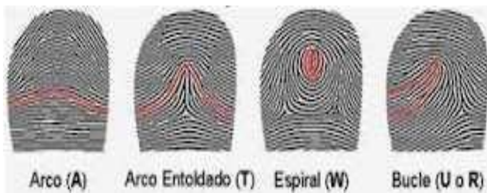
Figura 2: Tipos de huellas digitales Nota: Delgado (s.f.)

(b) Iris, es el tipo de estudio que requieren diversas condiciones en su escaneado como la posición de la misma, la iluminación misma, el ángulo de la toma y el momento del cierre de los párpados. Para ello se emplea una cámara de especial con infrarrojos que realiza la toma con muy alta resolución a 30 centímetros de distancia; (c) La retina, es el órgano humano presenta