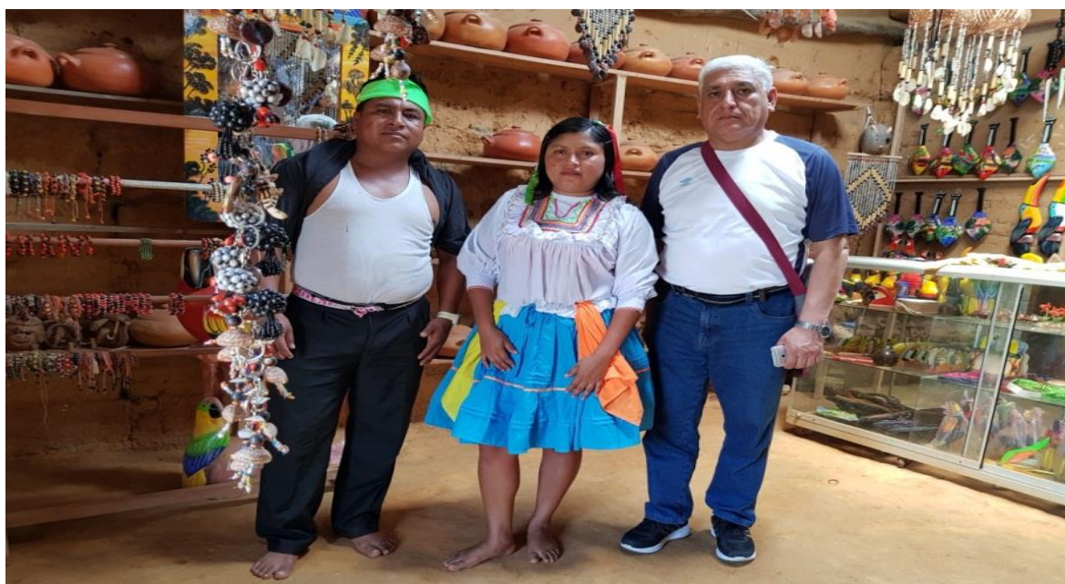
Vestimenta típica de la comunidad nativa wayku quechua