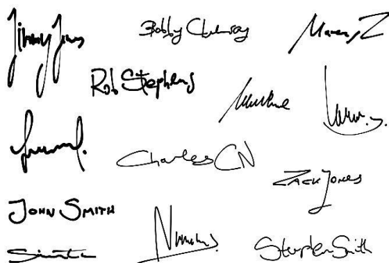
Figura 4: Muestra de firmas Nota: Delgado (s.f.)

que en ella se da, la forma del inicio y final de su trazo, su concavidad, el centro geométrico y el nivel de inclinación; el cual va a permitir establecer una información e identificar que la persona es la autora de la misma (ver figura 4).