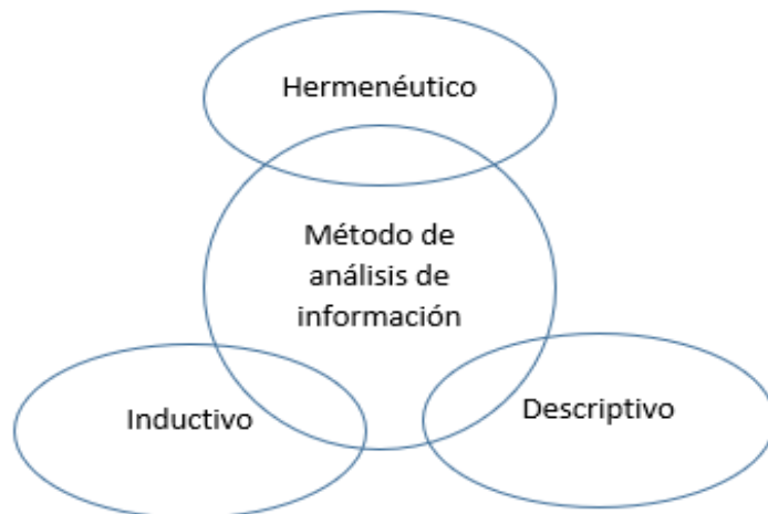
Figura N°1 – Gráfico sobre los métodos de análisis de información

Este estudio utilizará diferentes métodos de análisis, por el método hermenéutico , se estudiarán diferentes fuentes de información con el fin de comprender el marco teórico y los datos recopilados respecto al instrumento de la recolección de datos. El método descriptivo , que nos permite mediante la observación interpretar una situación de valorar todas las cosas, en base a dicha interpretación en su contexto. El método inductivo que utilizará el fenómeno de observación y finalmente comparativo, el cual nos ayudará a comparar resultados con otras investigaciones que se basan en normativas legales, principios y leyes científicas.