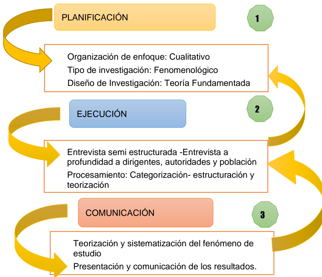
Figura 1 Diseño de investigación

Nota. Diseño adaptado de Flick (2012, p. 57) el modelo de proceso en la investigación de la teoría fundamentada.