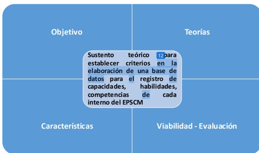
Figura 2: Sustento teórico 12 para establecer criterios en la elaboración de una base de datos para el registro de capacidades, habilidades, competencias de cada interno del EPSCM.