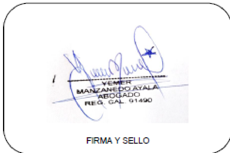
FIRMA Y SELLO

Según mi perspectiva no sería viable la tenencia compartida para aquellos niños, niñas o adolescentes menores de 4 años, tampoco la modificatoria introducida indica la edad mínima para efectos de la tenencia compartida.