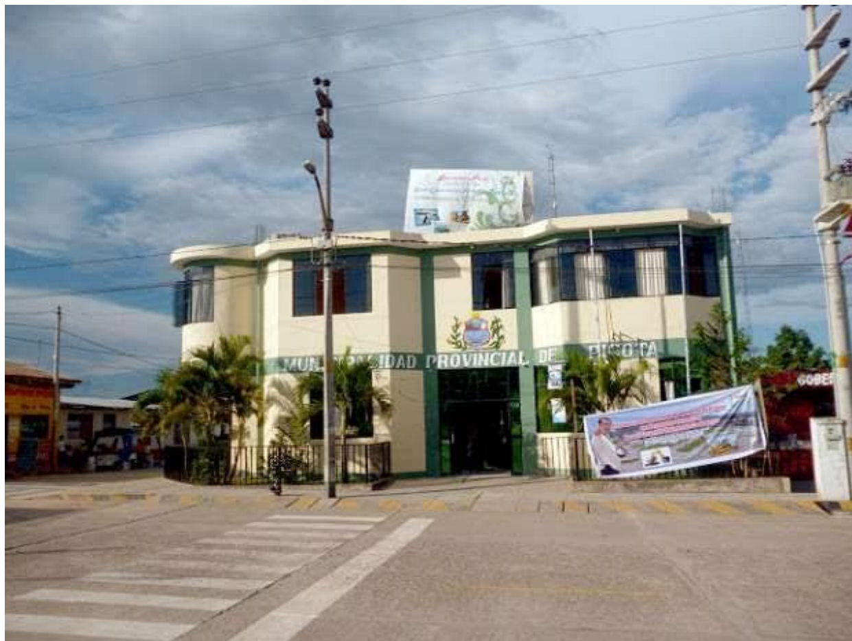
Municipalidad Provincial de Picota.