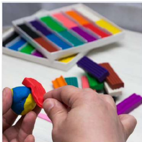
Figura 2. Recreación del modelaje con plastilina.

Se observó que una de las actividades que más destaca es el modelado con plastilina, ya que con esto los niños fortalecen las habilidades manuales y la creatividad, al mismo tiempo que pueden idear historias y recursos de su imaginación (figura 2). También se pudo observar que solo un 12,4% de los niños no logró alcanzar satisfactoriamente todas las actividades. Lo que muestra que un alto porcentaje de estudiantes alcanzó mejorar sus habilidades manuales.