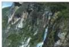
CATARATA EL CHORRO