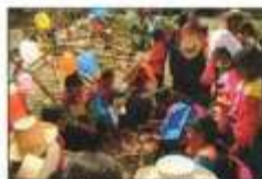
PARADA DE LA YUNZA