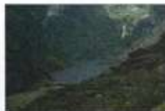
LAGUNA SHIN SHIN