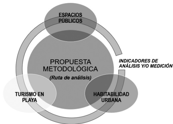
Figura 2: Propuesta metodológica del estudio. Elaboración Propia.

Para el presente estudio de tipo descriptivo, de análisis y revisión bibliográfica, se han recopilado estudios referidos a la variable principal del trabajo, determinada como la habitabilidad urbana aplicable a espacios públicos costeros y como ella puede ser estudiada para potenciar el turismo a través de una ruta de trabajo que permita ser aplicada a espacios de playa mediante la integración de una matriz que articule conceptos turísticos con indicadores de habitabilidad en espacios públicos, como se observa en la siguiente figura: