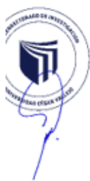
Firma del evaluador DNI 18099237