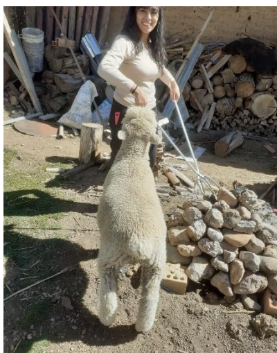
Figura 2. Realización de la pachamanca