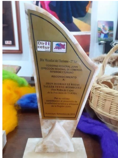
Figura 7. Premiación al artesano