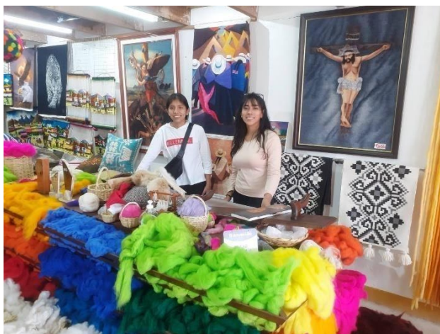
Figura 1. Visita al taller textil