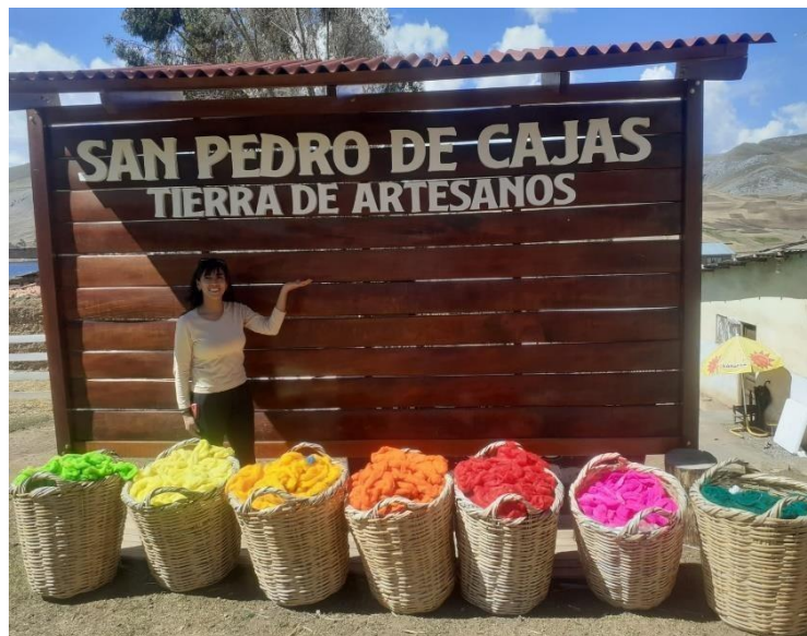
Figura 8. Portada del lugar