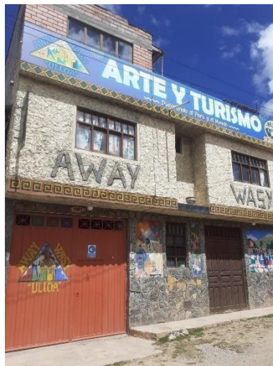
Figura 6. Casa del artesano Away Wasy