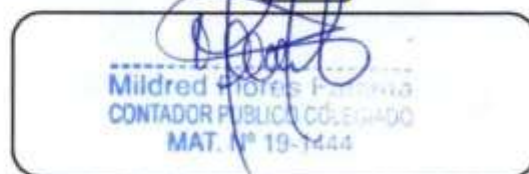
Sello personal y firma