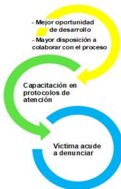
Figura N° 02 – Respecto al gráfico acerca de la asistencia y la protección integrales en la revictimización contra la mujer

Para consolidar lo antes señalado y así graficar lo manifestado, se dio por ilustrar el grafico siguiente: