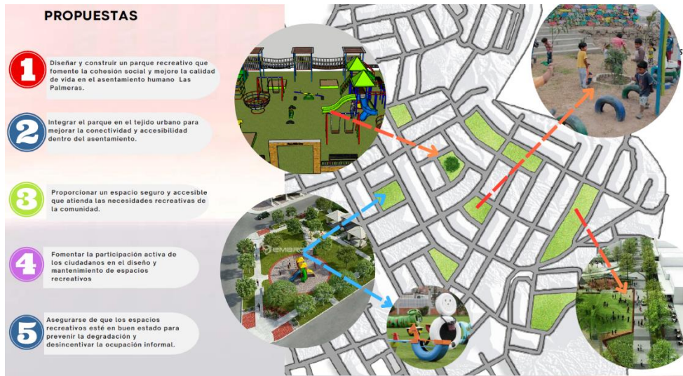
Figura 5. Planificación de espacios recreativos

Nota: Espacios recreativos adecuados que brindan confort a los habitantes.