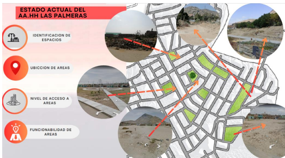
Figura 3. Estado actual del asentamiento humano Las Palmeras

Nota: Estado actual de los espacios recreativos.