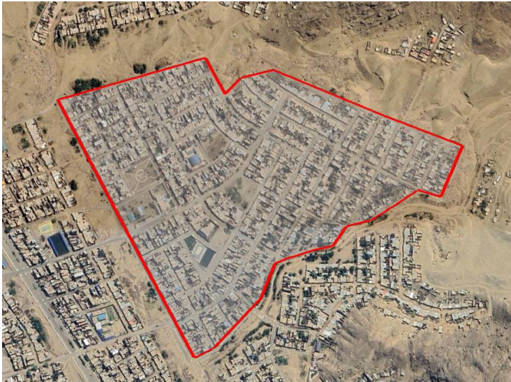
Figura 1. Delimitación del terreno