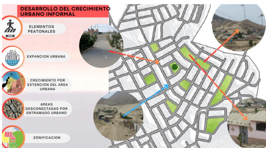
Figura 4. Desarrollo del crecimiento urbano informal

Nota: Crecimiento urbano descontrolado en la actualidad.