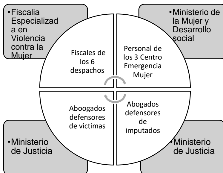
Figura 2 Participantes en la investigación.

Como se ha indicado e consideraron profesionales capacitados con licenciatura en derecho y experiencia, conocimientos y práctica relacionados con nuestro tema de investigación. Así dentro de la persona de la agencia fiscal se ha analizado el grado de antigüedad de los fiscales para requerirles su apoyo con la realización de entrevista, realizándose está a la fiscal coordinadora de las fiscalías especializadas y a dos fiscales de mayor antigüedad, así como a tres asistentes en función fiscal que, como personal de apoyo a la gestión fiscal, forman parte activa en la realización de las diligencias dentro del proceso de investigación de las carpetas fiscales de violencia contra la mujer